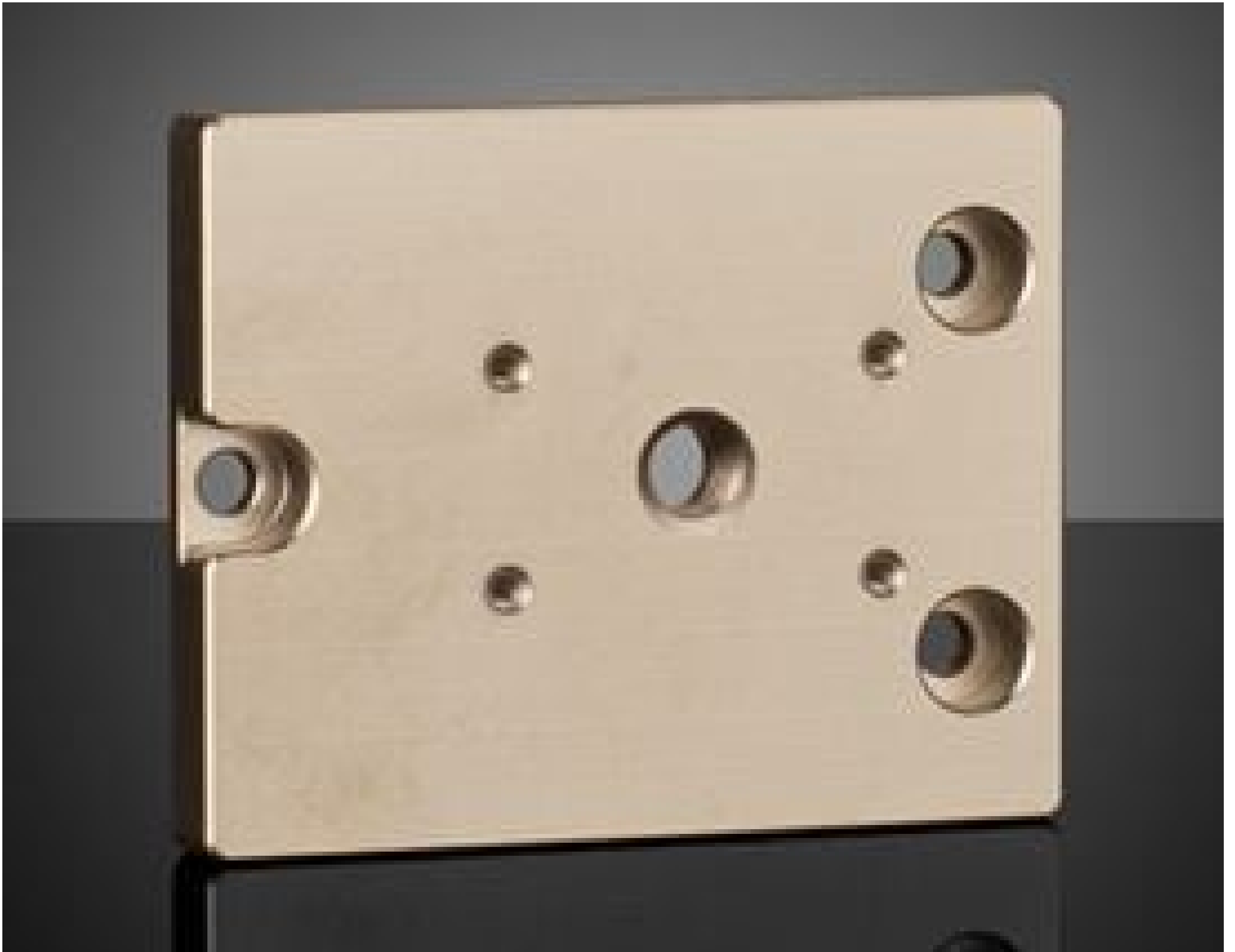
1/4-20 Mounting Adapter for Basler ace L GigE