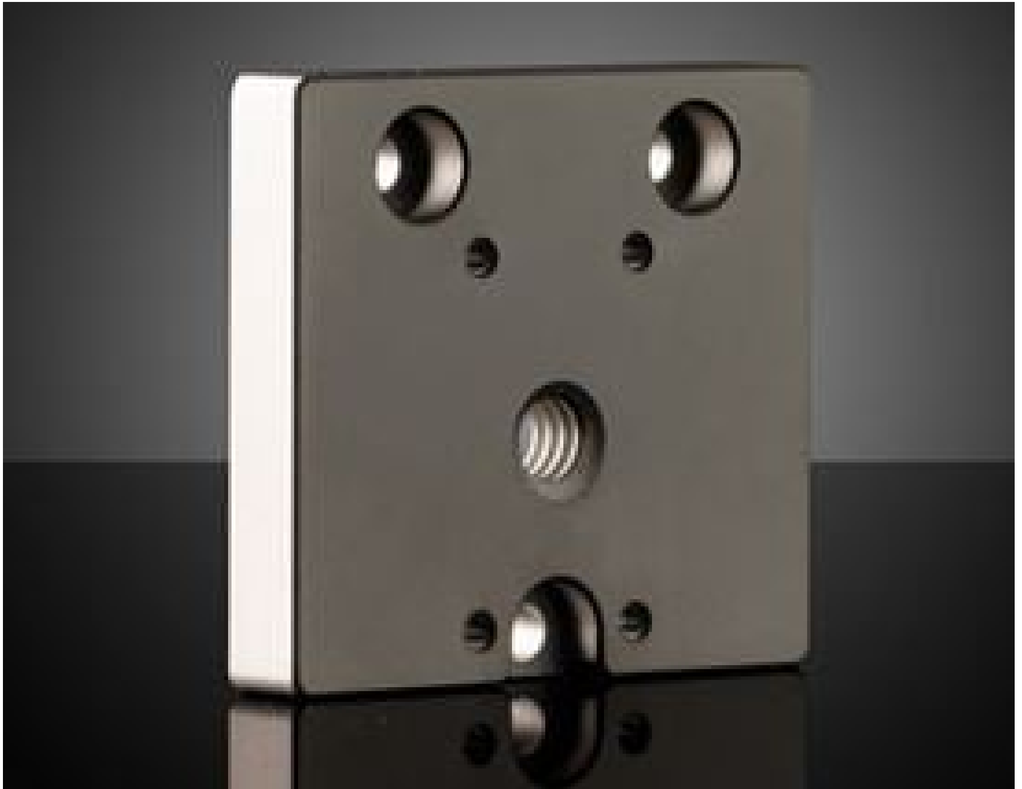
1/4-20 Mounting Adapter for Basler ace L USB 3.0