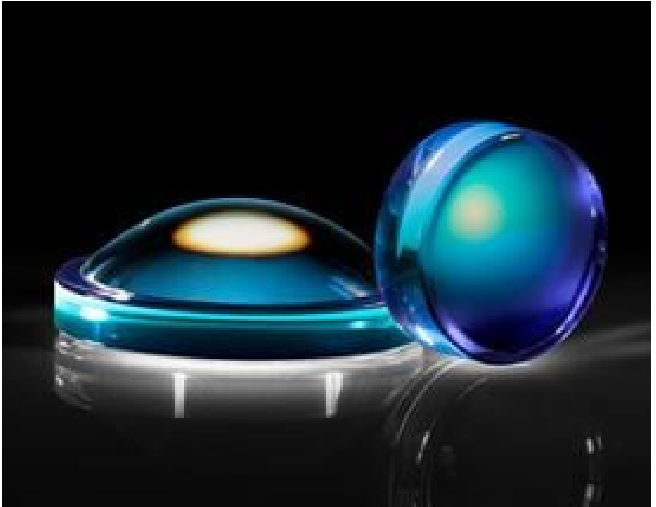
Precision Molded Aspheric Lenses