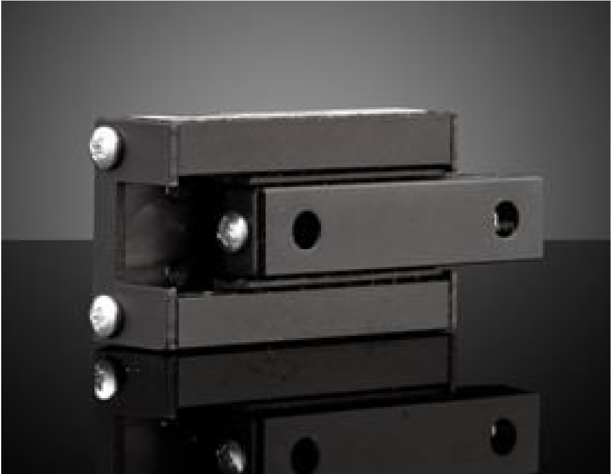
0.5" Travel, 1.12"L x 0.59"W Ball Bearing Slide, #53-849