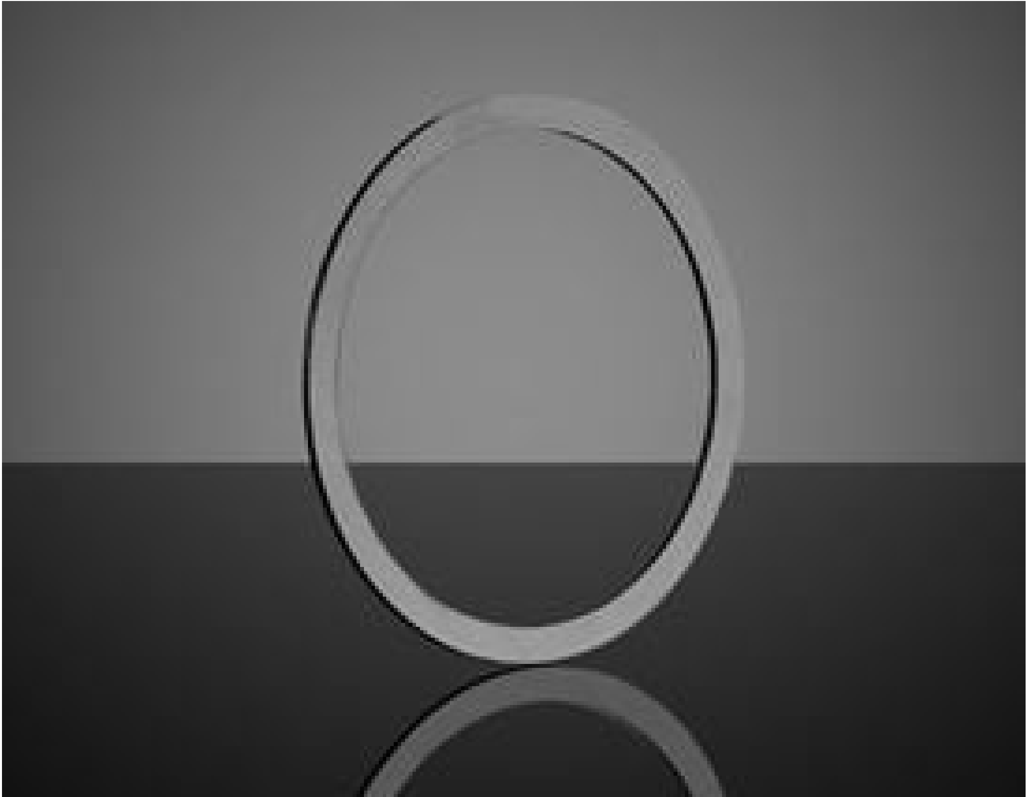
TECHSPEC Multi-Element Spacer Ring