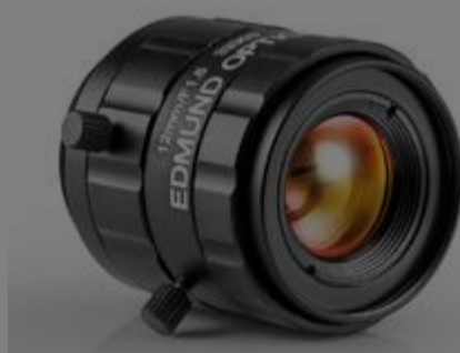
#33-303 - Objektiv mit Festbrennweite der UC-Serie, 12 mm €260,00