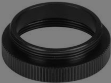
#03-618 - 5 mm Abstandsring zur Umwandlung von CS-Mount-Kameras in C-Mount €29,00