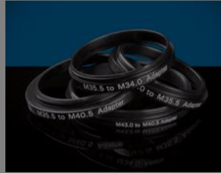
Gewindeadapter für Filter