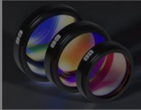
Bildverarbeitungsfilter und Zubehör