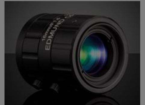
#59-870 - Objektiv mit Festbrennweite der C-Serie, 16 mm €260,00