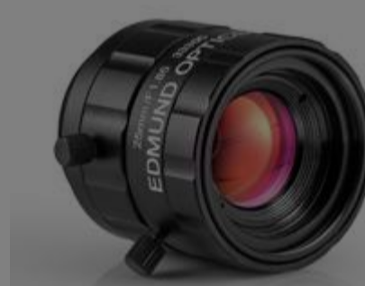
#33-305 - Objektiv mit Festbrennweite der UC-Serie, 25 mm €260,00