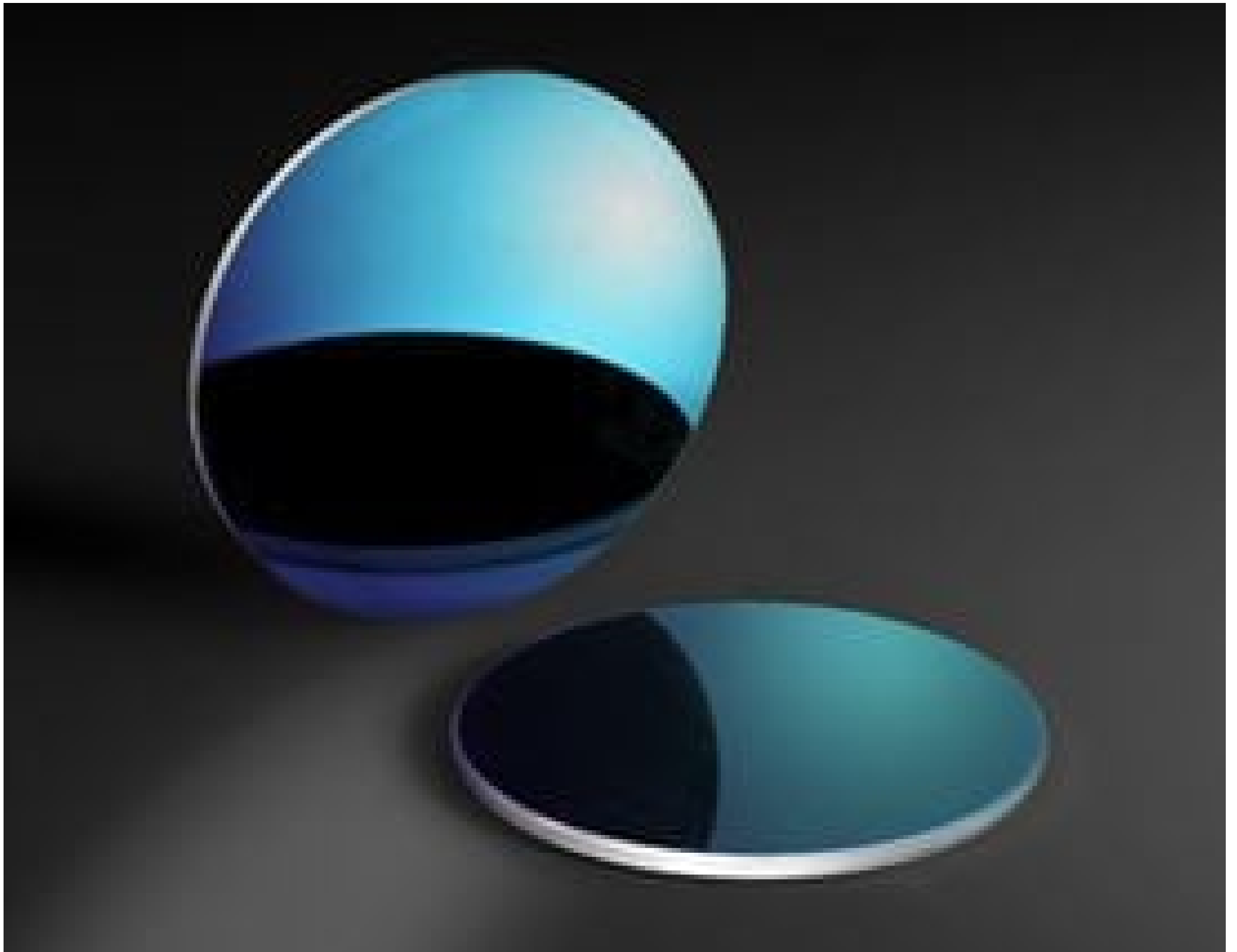
Infrared (IR) Neutral Density (ND) Filters