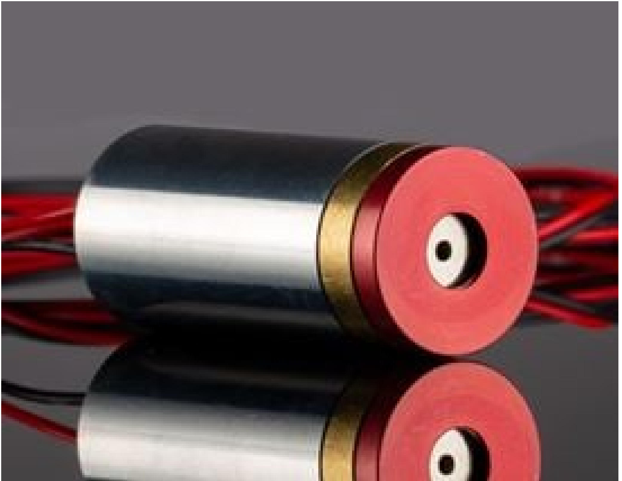
Coherent® VHK™ Circular Beam Visible Laser Diode