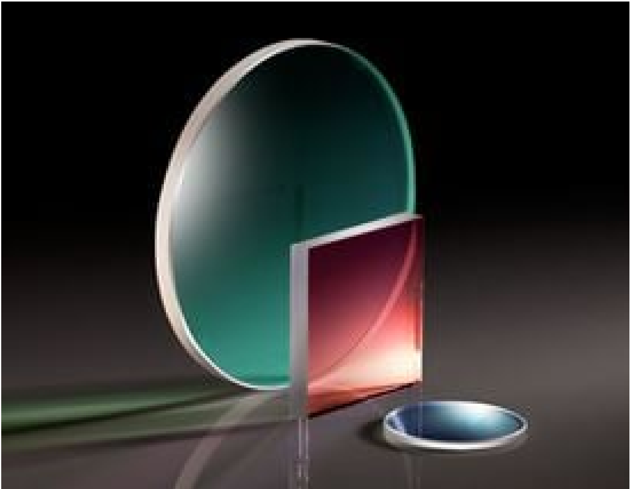
TECHSPEC High Performance Hot Mirrors