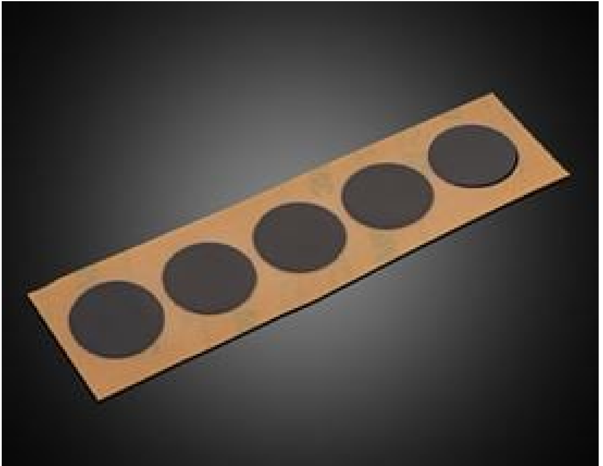
Acktar Die-Cut Light Blocking Black Labels