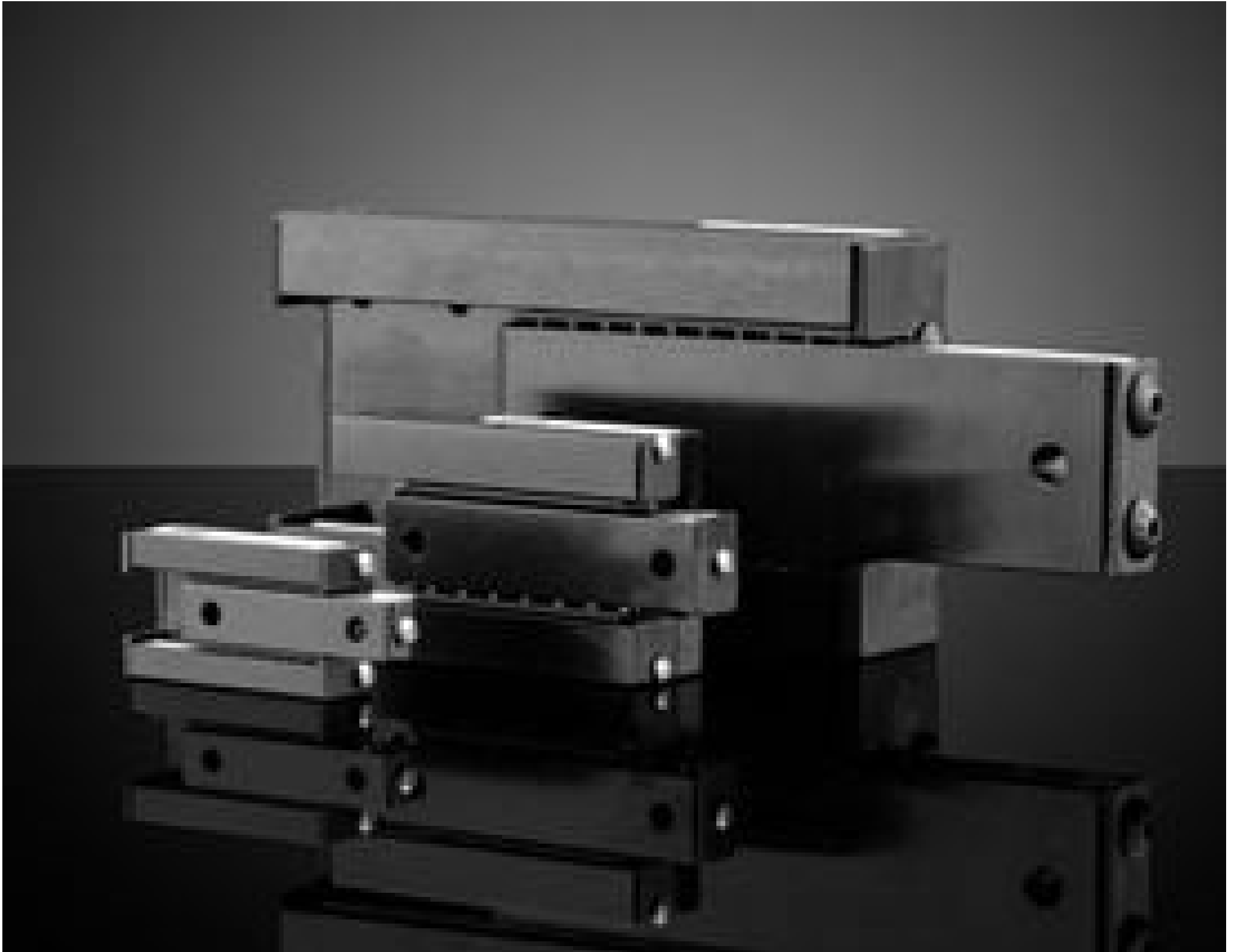
Linear Motion Ball Bearing Slides