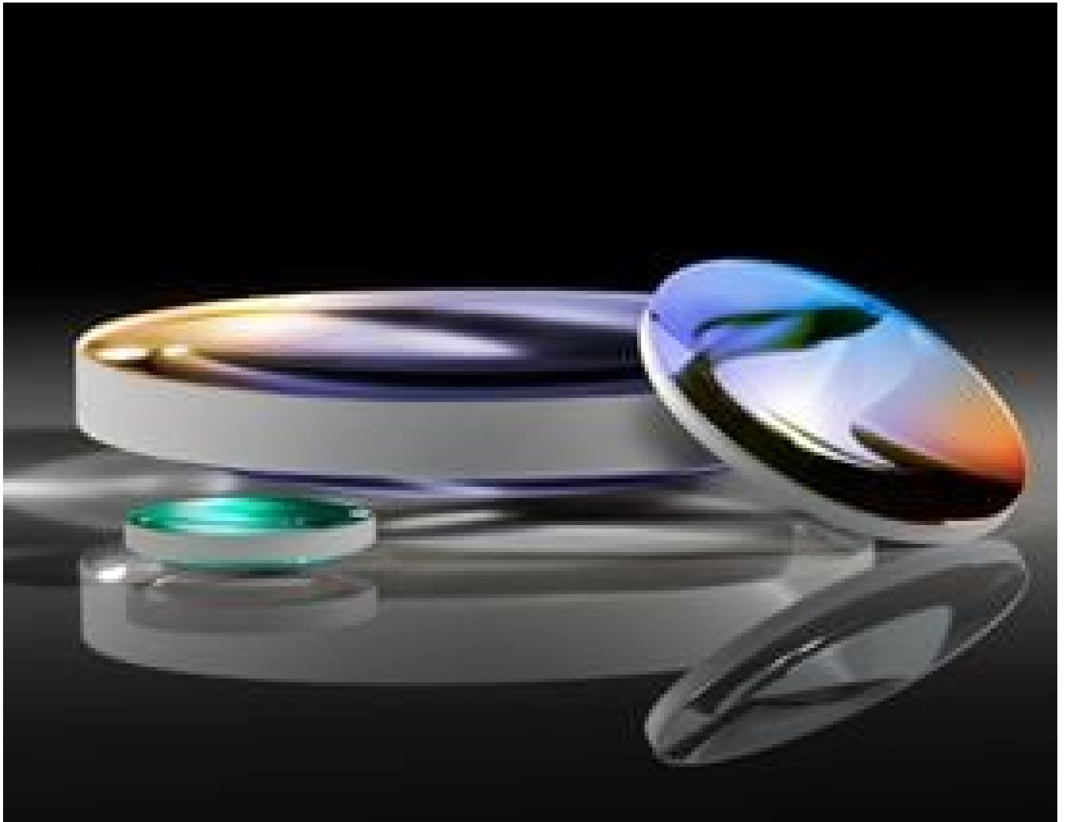
YAG-BBAR Coated Plano-Convex (PCX) Lenses