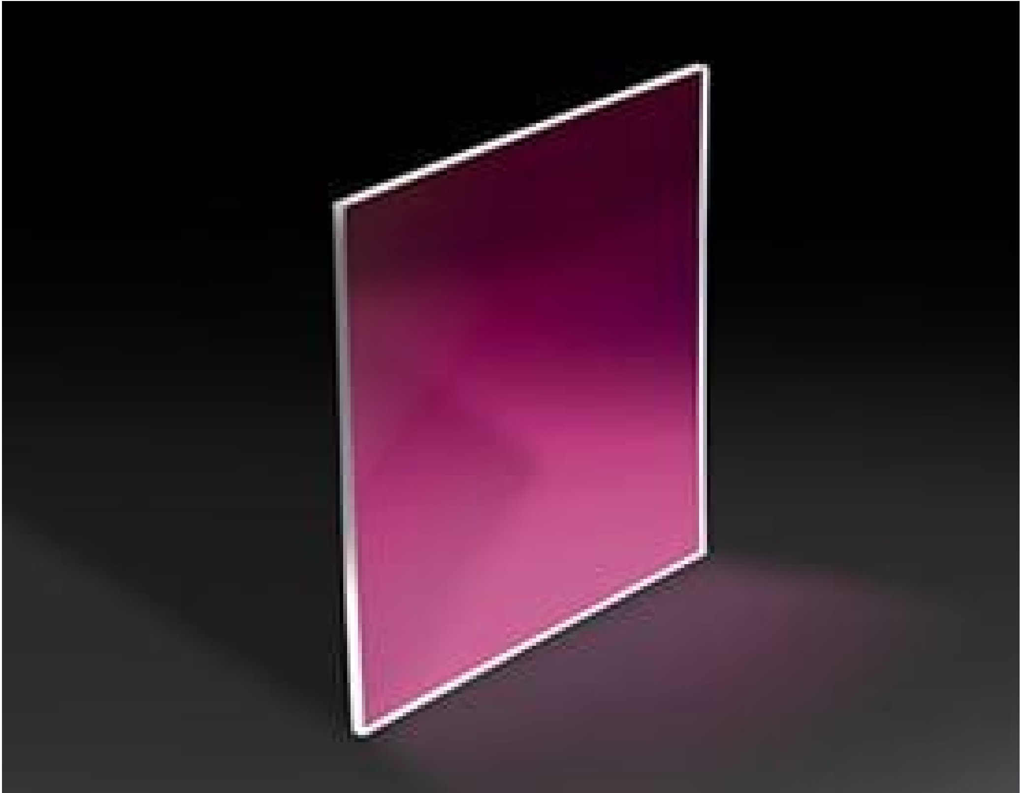
Gorilla® Glass Windows