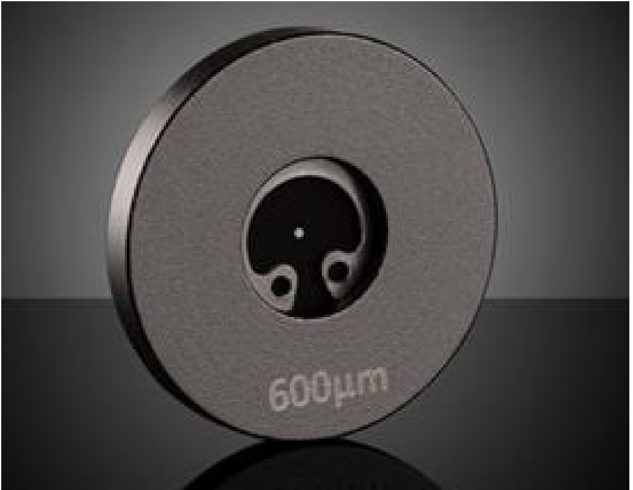
Acktar Blackened Pinholes (mounted)