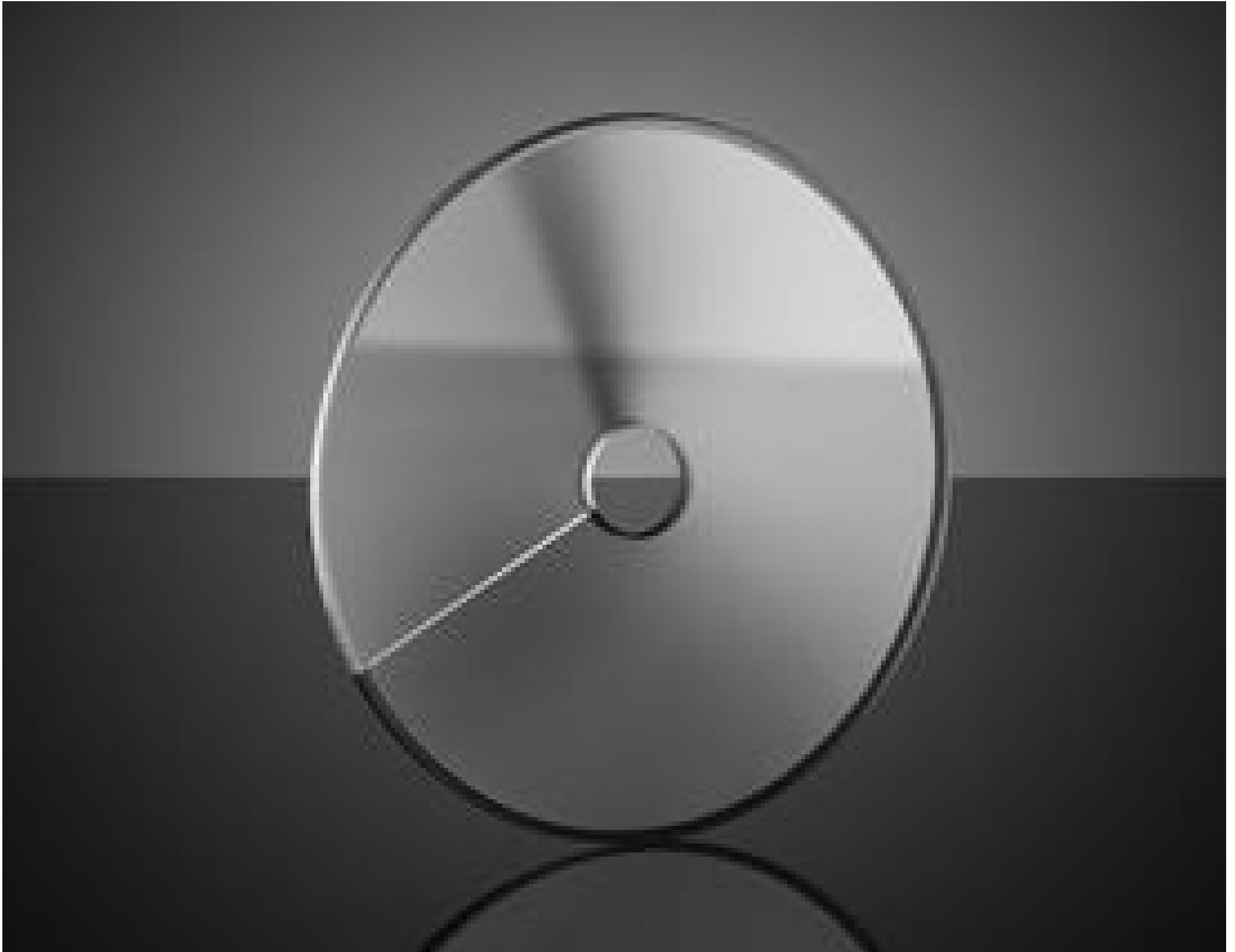
Unmounted Circular Variable Neutral Density (ND) Filters