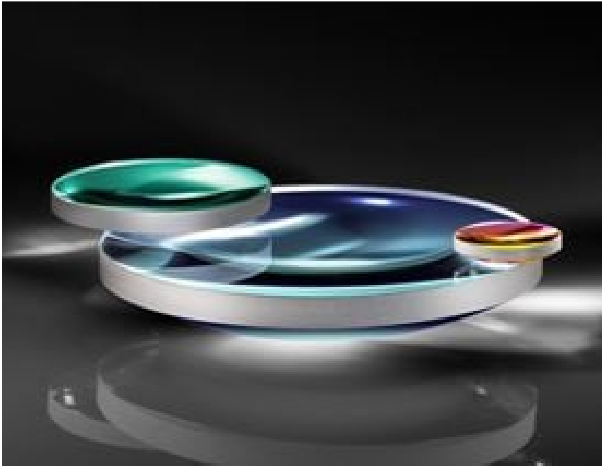
633nm Laser Line Coated Plano-Convex (PCX) Lenses