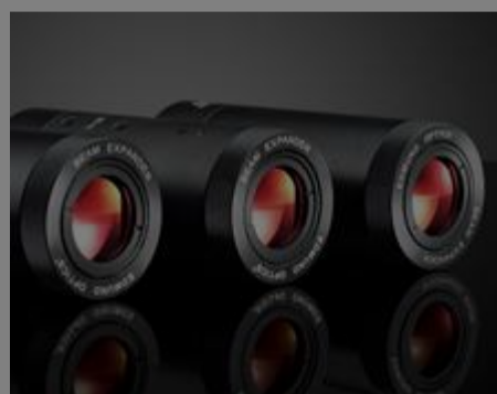
Arcturus ® HeNe-Strahlaufweiter