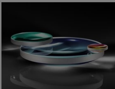
633nm Laser Line Coated Plano-Convex (PCX) Lenses