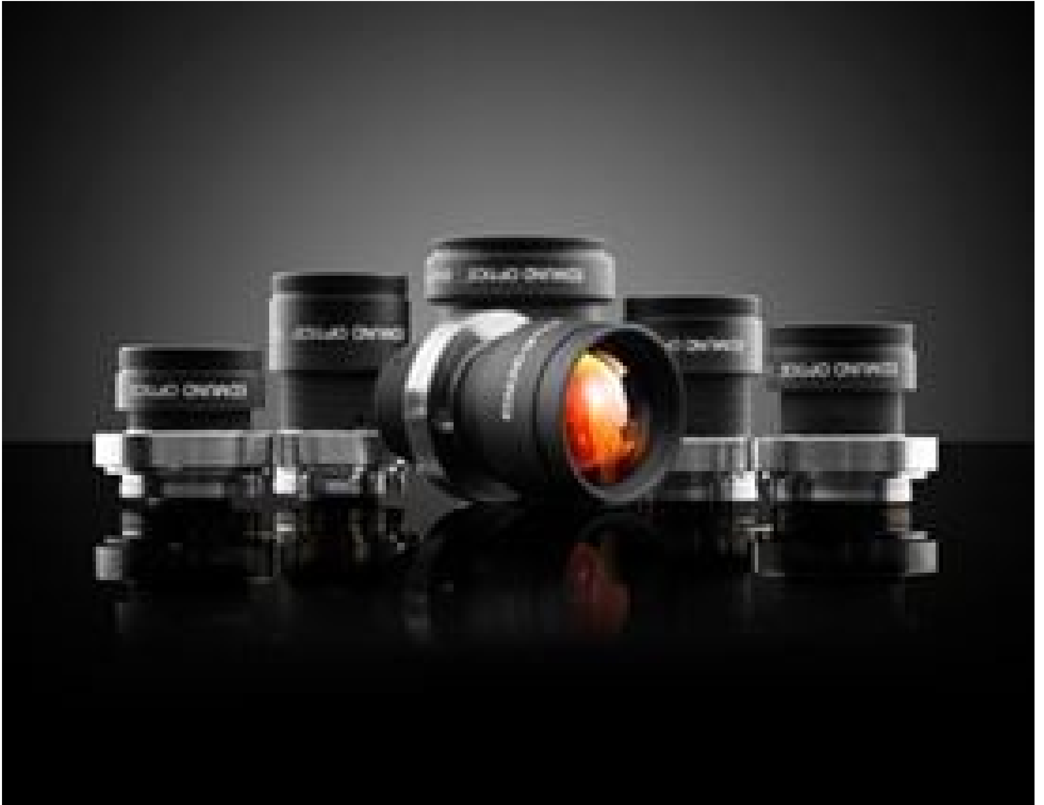
TECHSPEC® Cr Series Fixed Focal Length Lenses