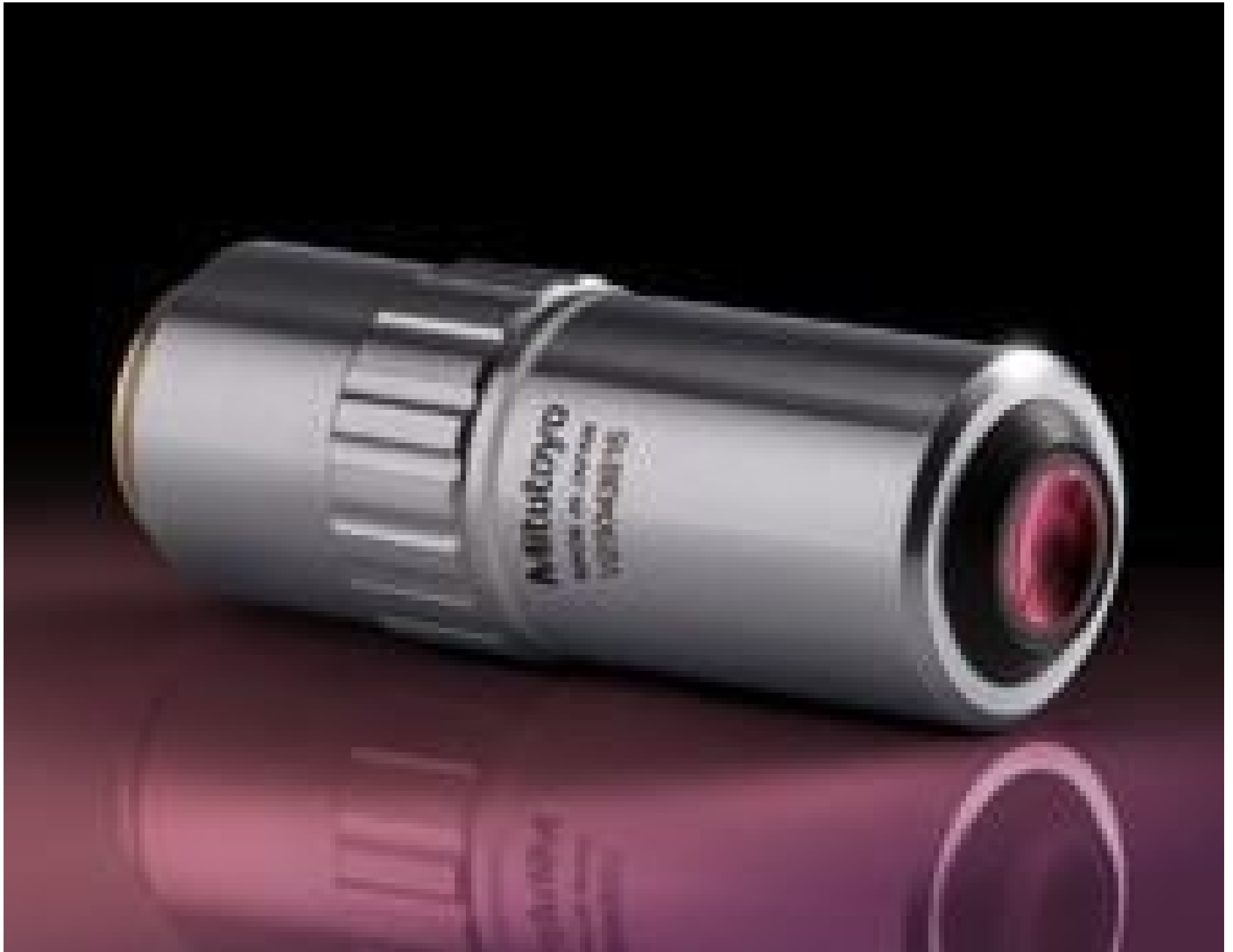
100X Mitutoyo Plan Apo Infinity Corrected Long WD Objective, #46-147