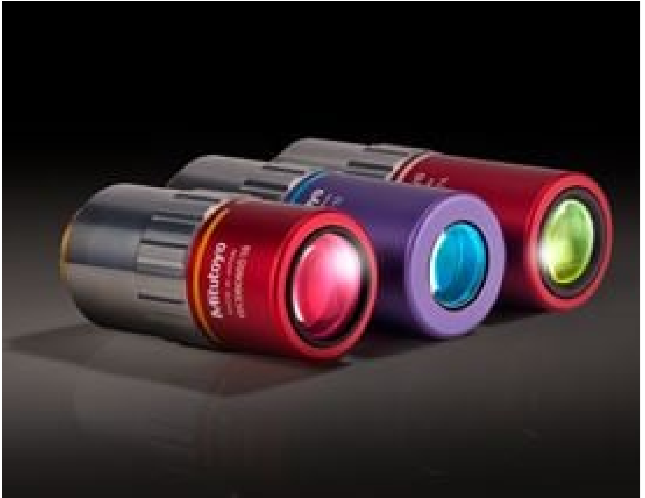
Mitutoyo NIR, NUV, and UV Infinity Corrected Objectives