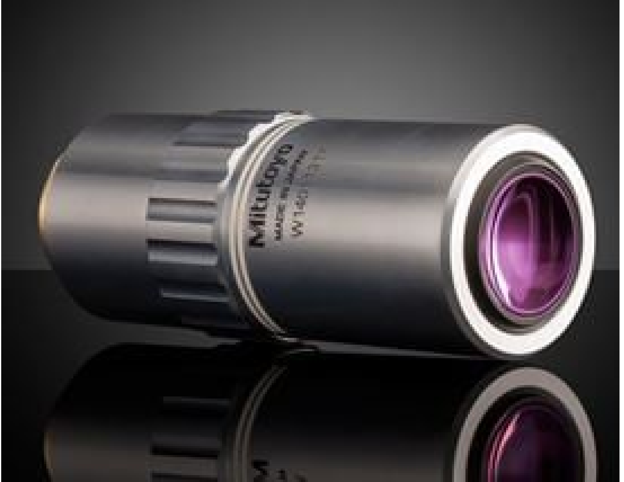
100X Mitutoyo Plan Apo SL Infinity Corrected Objective, #46-401