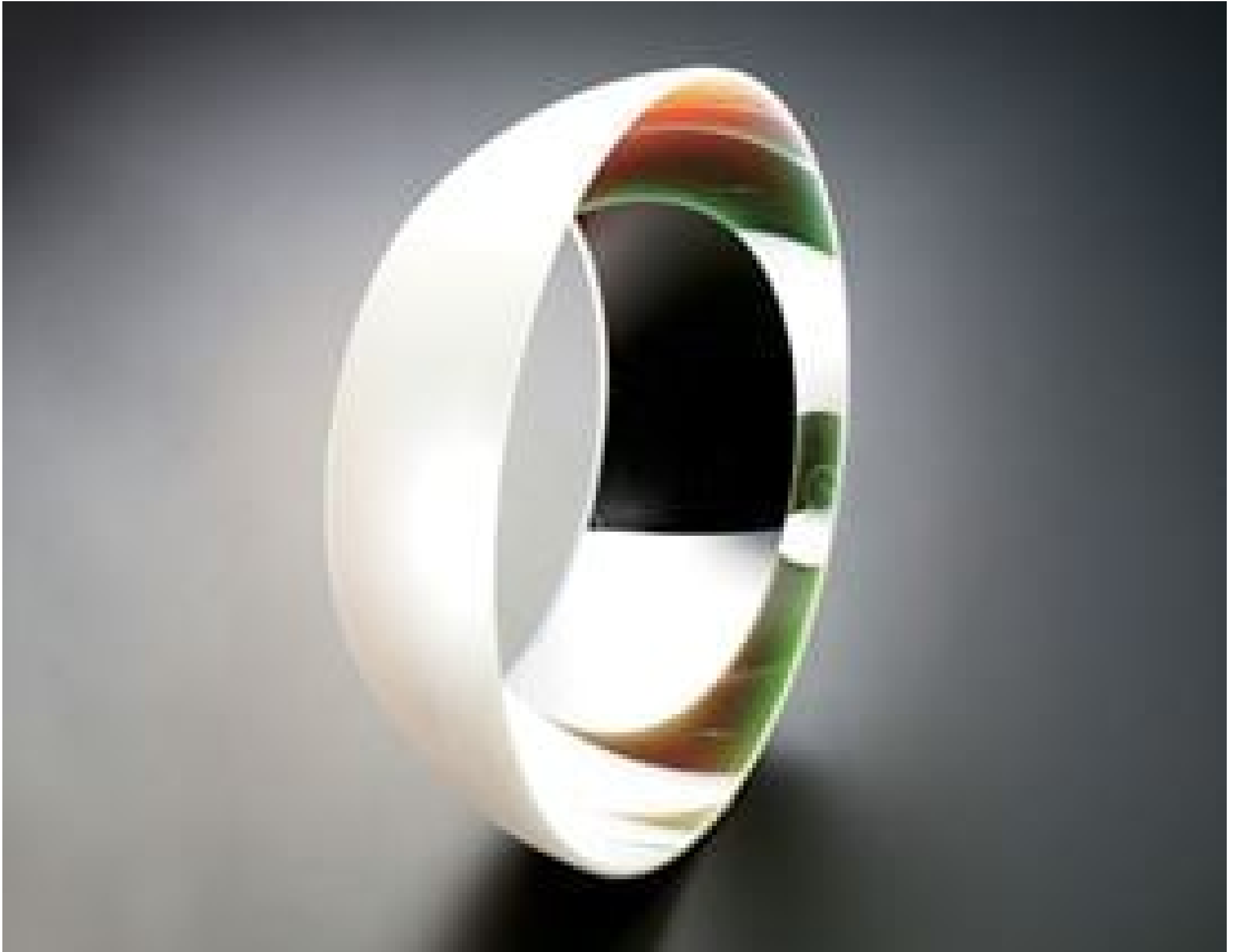
Precision Ellipsoidal Reflectors