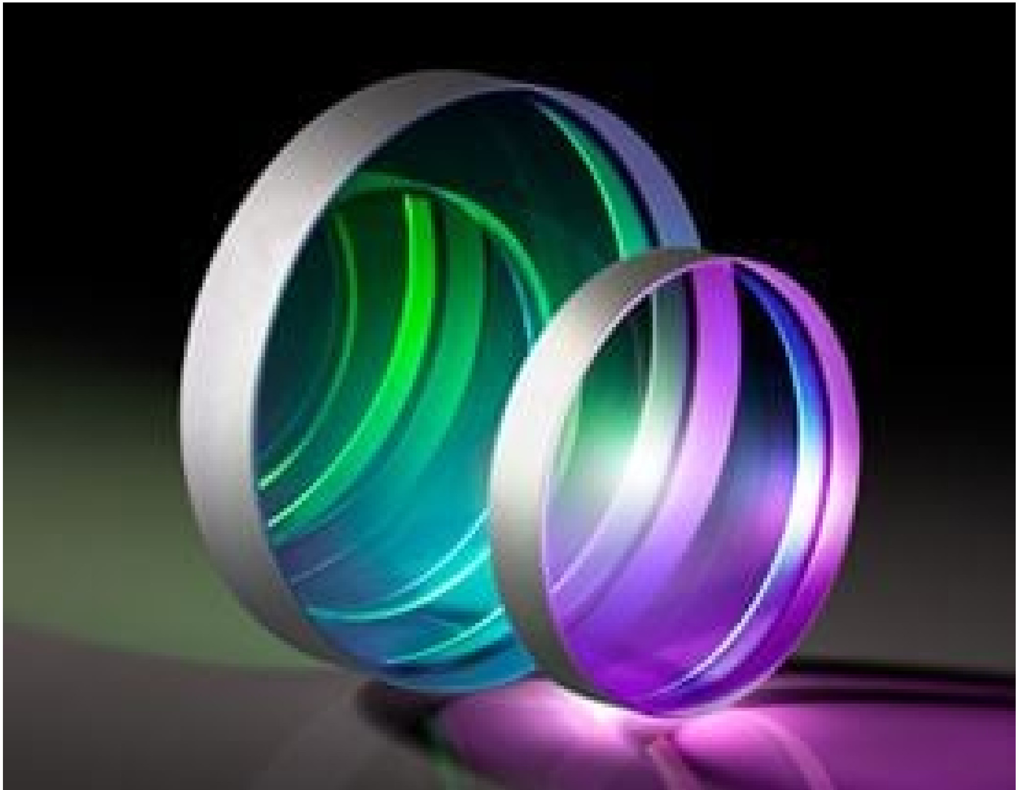
TECHSPEC® Nd:YAG Laser Output Couplers