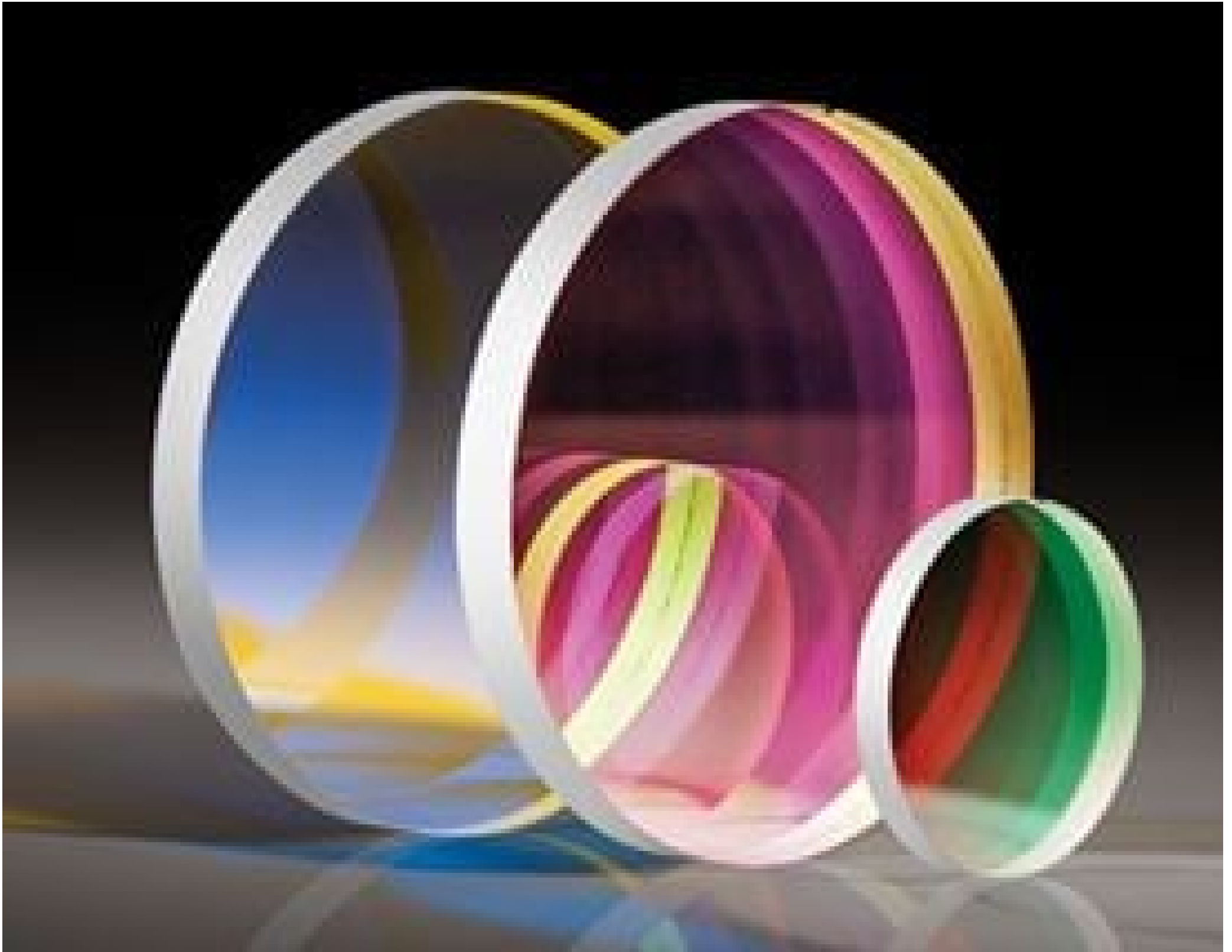
High Performance OD 4.0 Longpass Filters