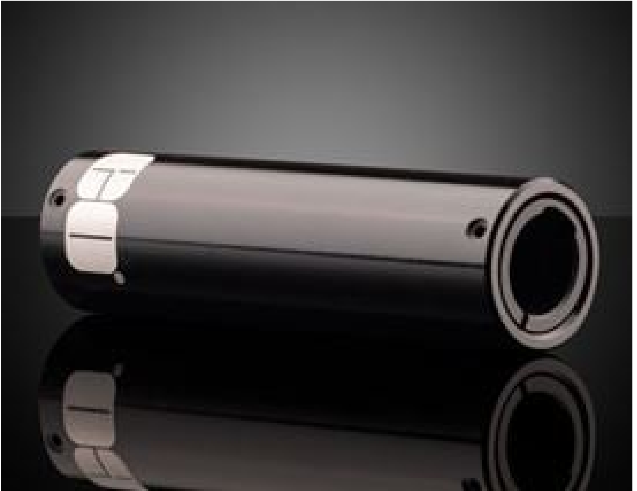
10mm Aperture, 75mm Length, Light Pipe Homogenizing Rod Mount, #64-919