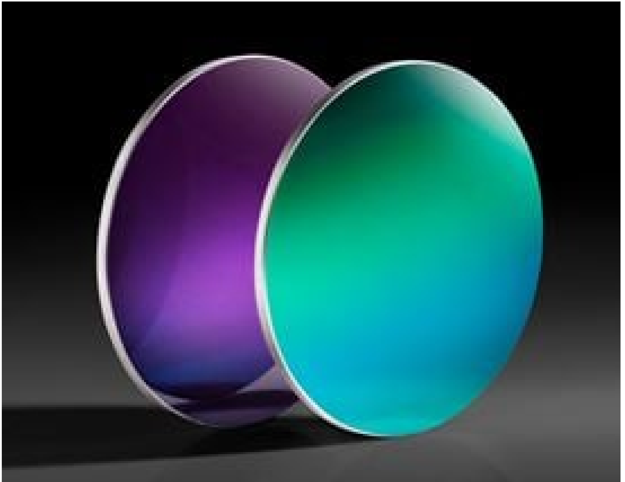
TECHSPEC Silicon (Si) Windows