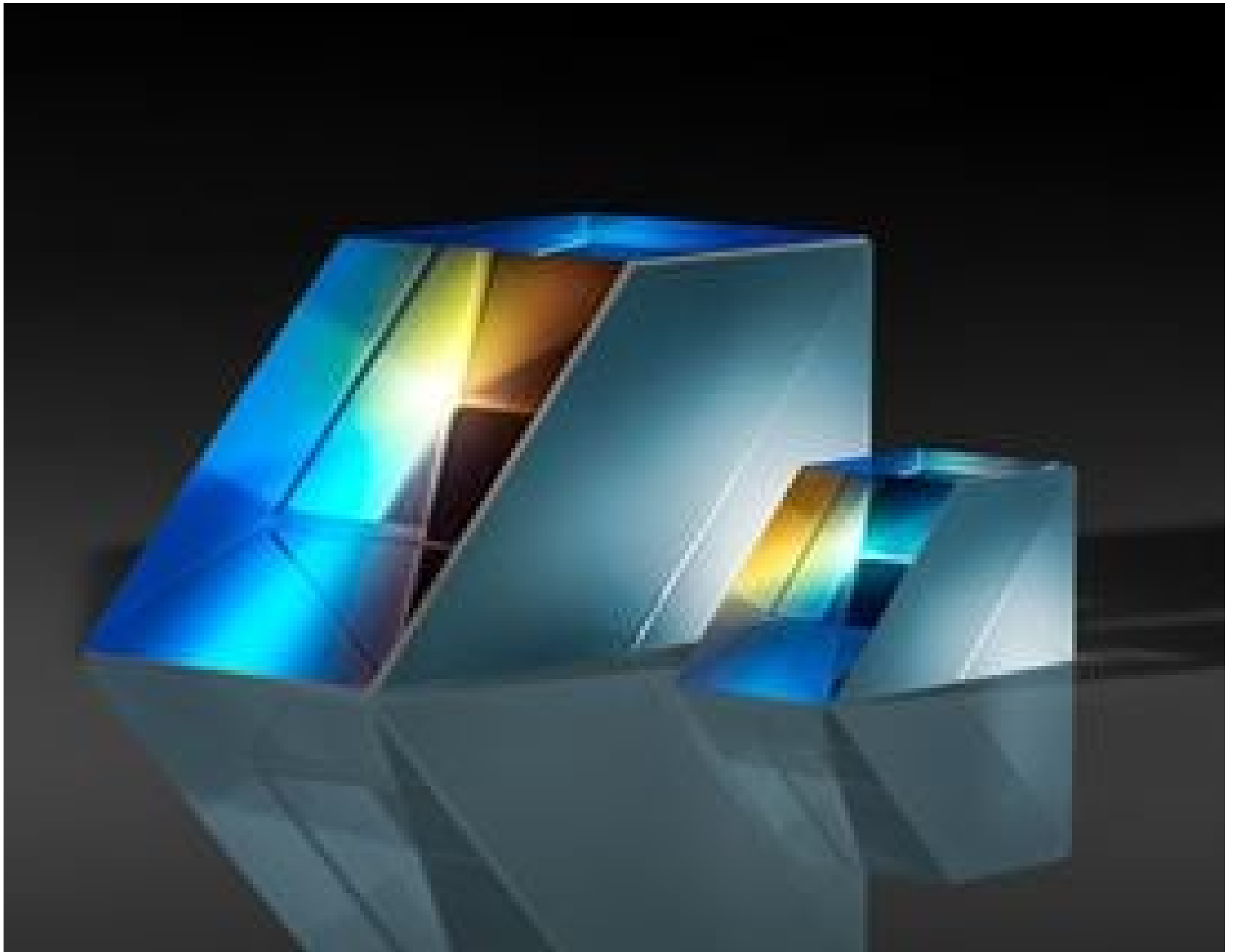
Lateral Displacement Beamsplitters