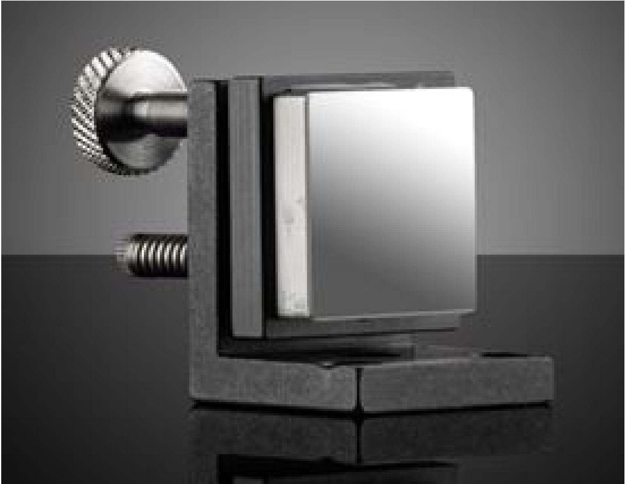
1.0" Angle Mirror Mount with Mirror