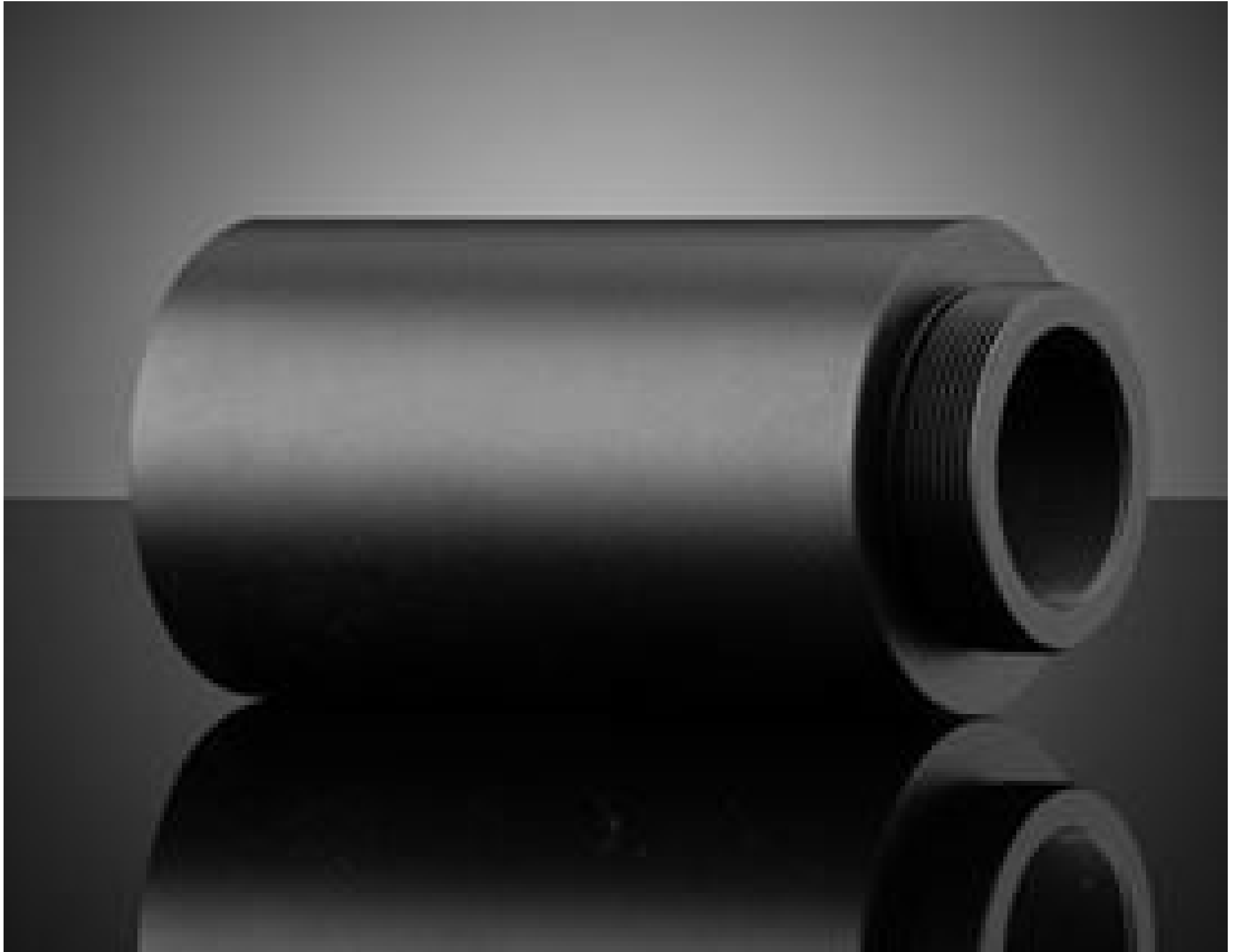
#24-218: 5X, 95mm M26 Parfocal Adapter