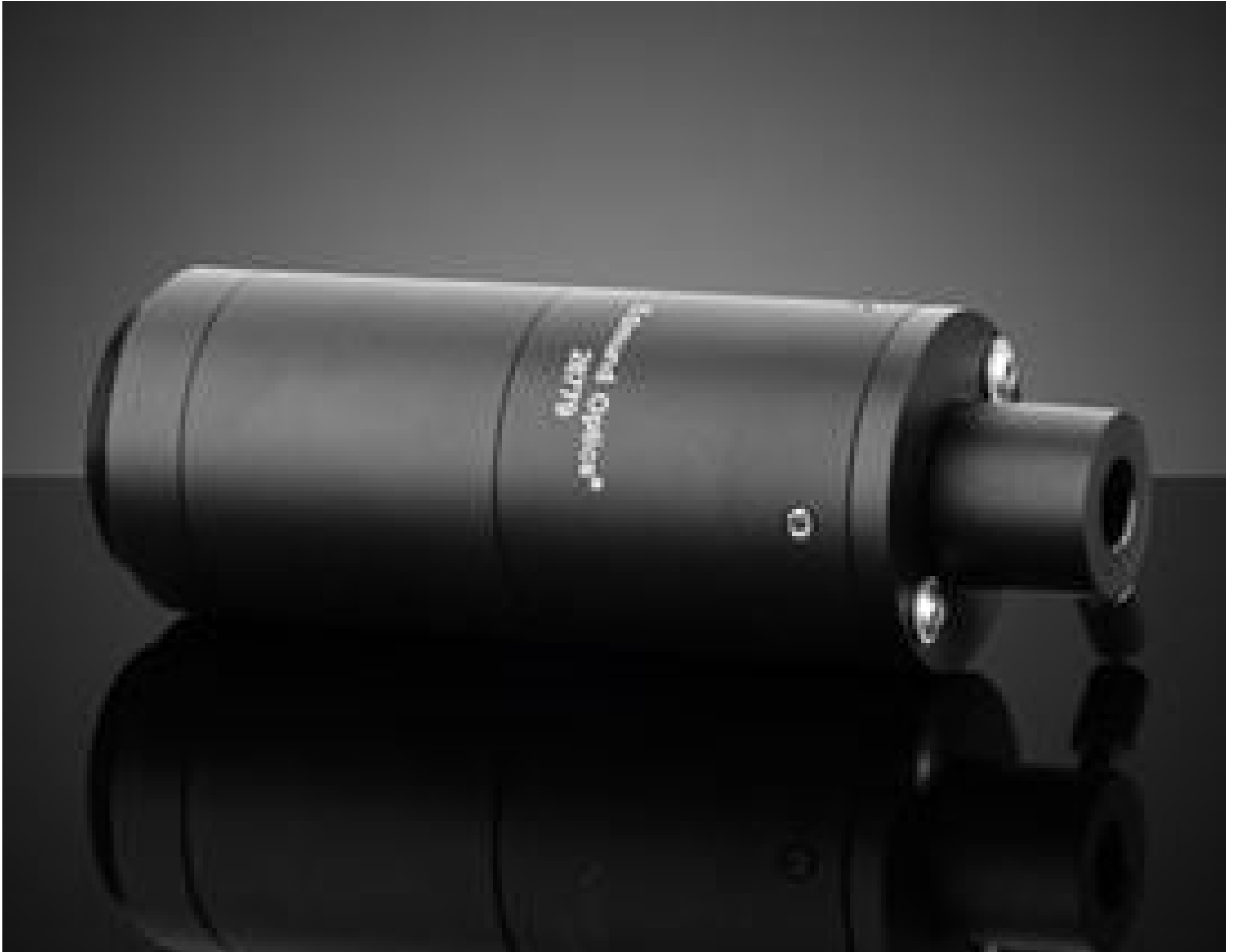
10X Focusing Lens