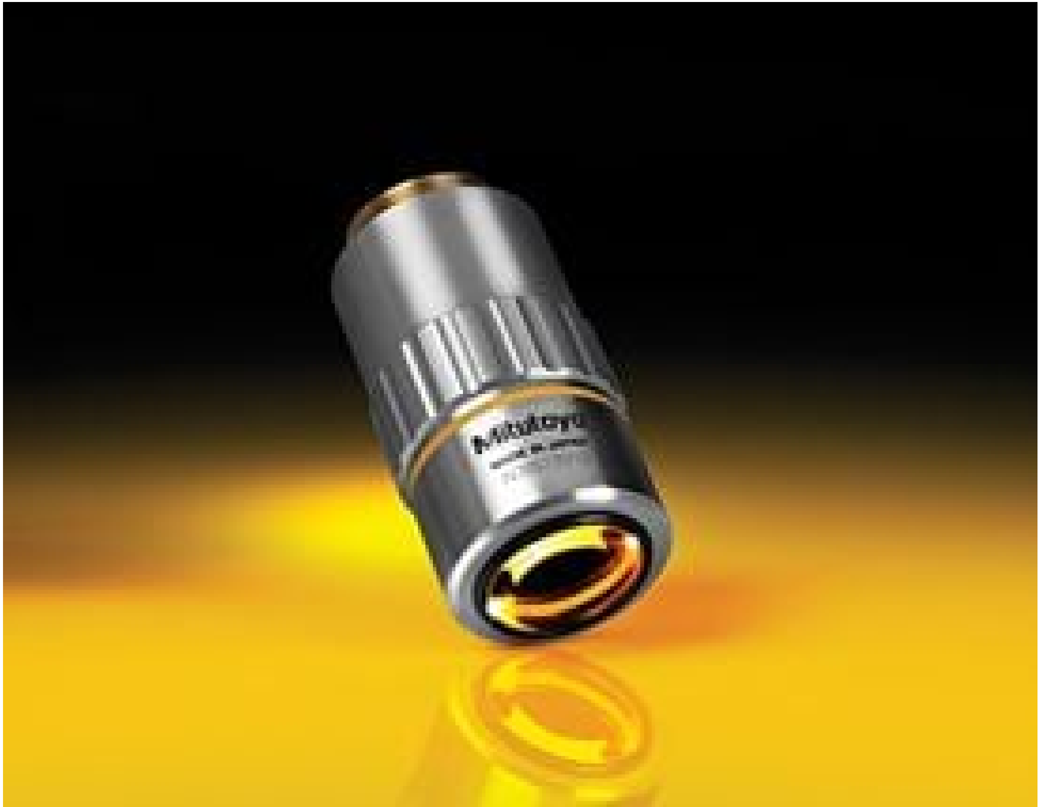
10X Mitutoyo Plan Apo Infinity Corrected Long WD Objective, #46-144