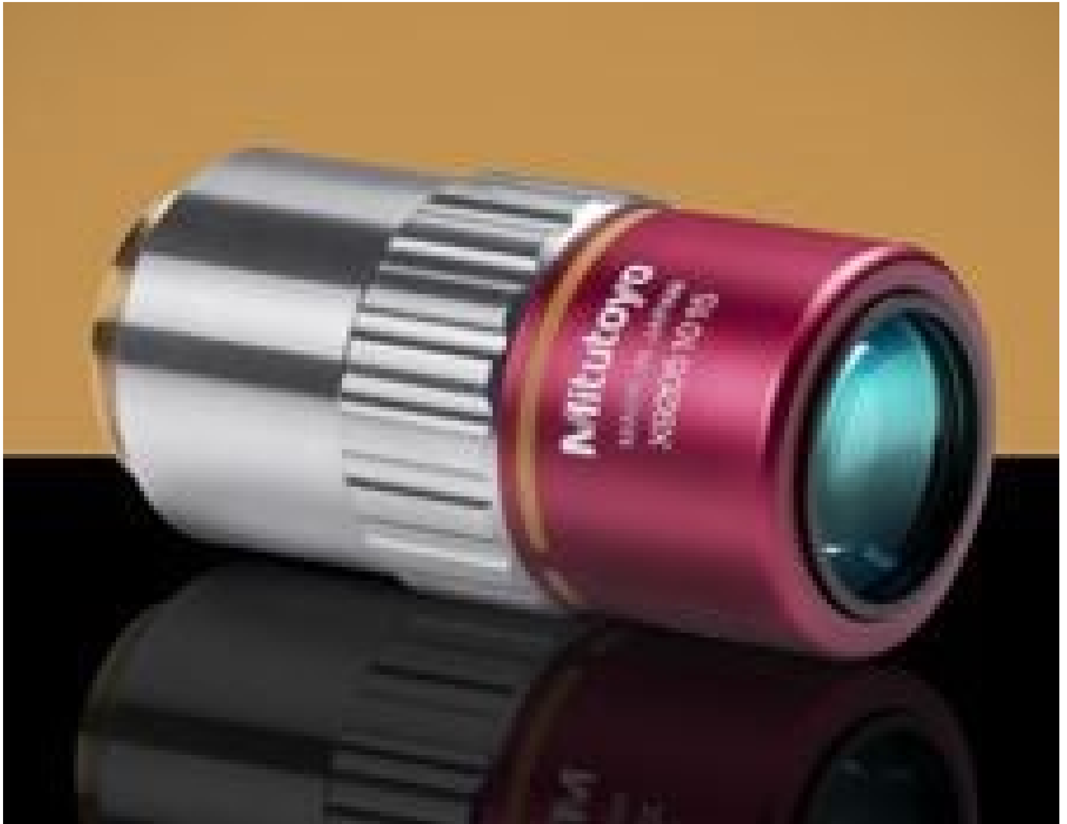
10X Mitutoyo Plan Apo NIR Infinity Corrected Objective, #46-403