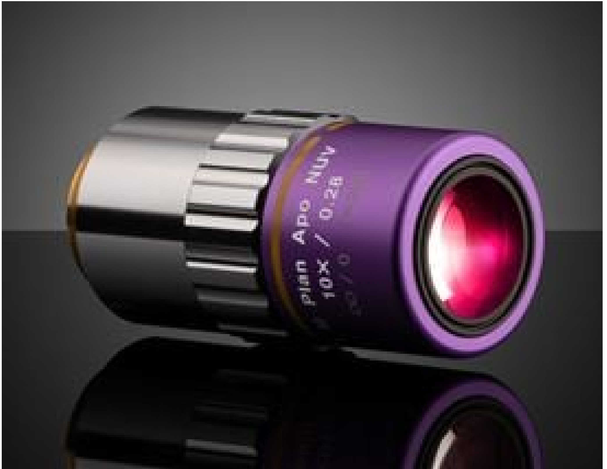
10X Mitutoyo Plan Apo NUV Infinity Corrected Objective, #86-176