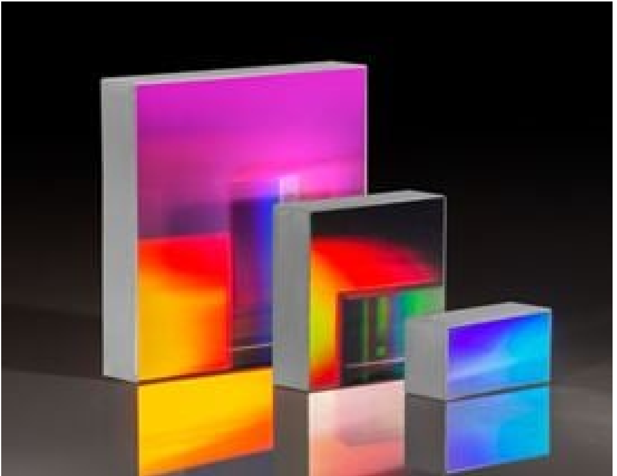
Reflective Ruled Diffraction Gratings