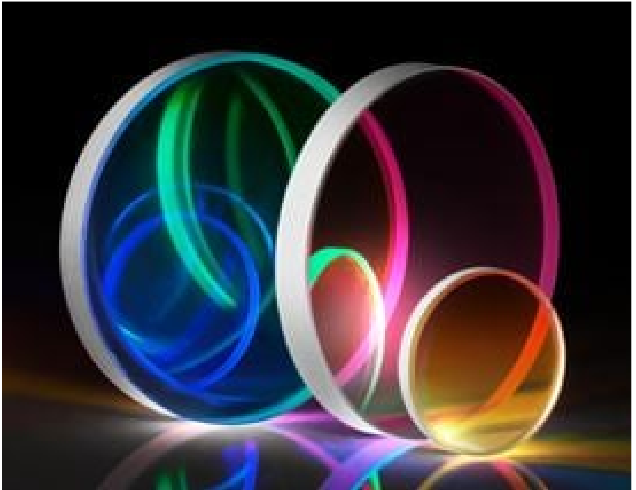
TECHSPEC OD 2.0 Shortpass Filters