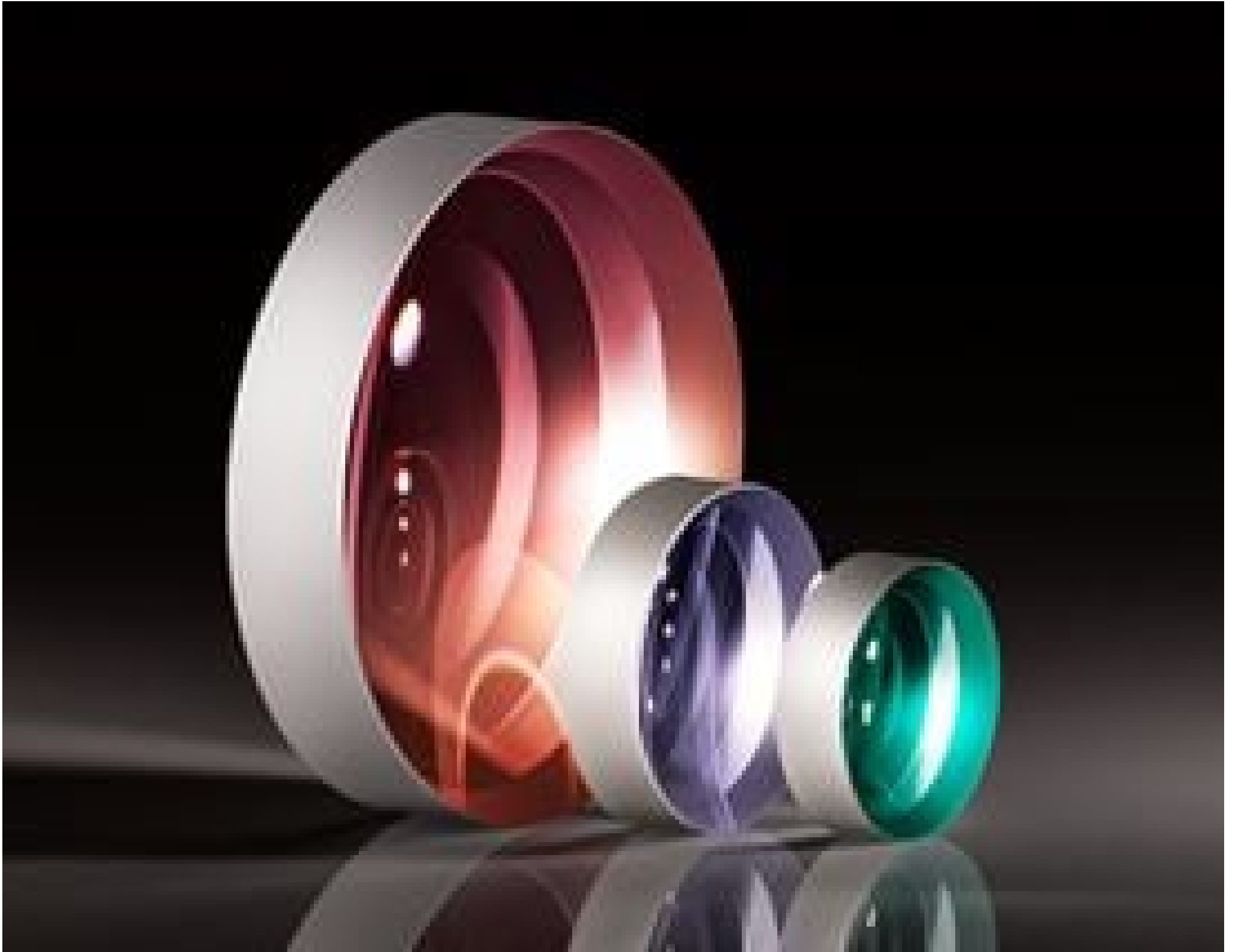
TECHSPEC Uncoated Plano-Concave (PCV) Lenses