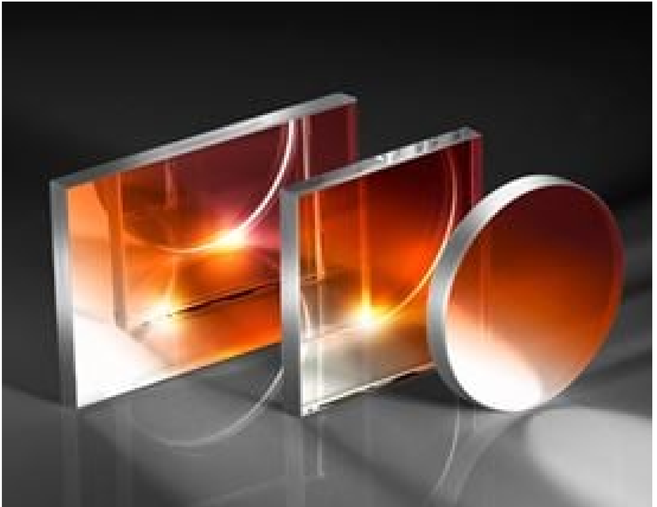
Visible and NIR Plate Beamsplitters