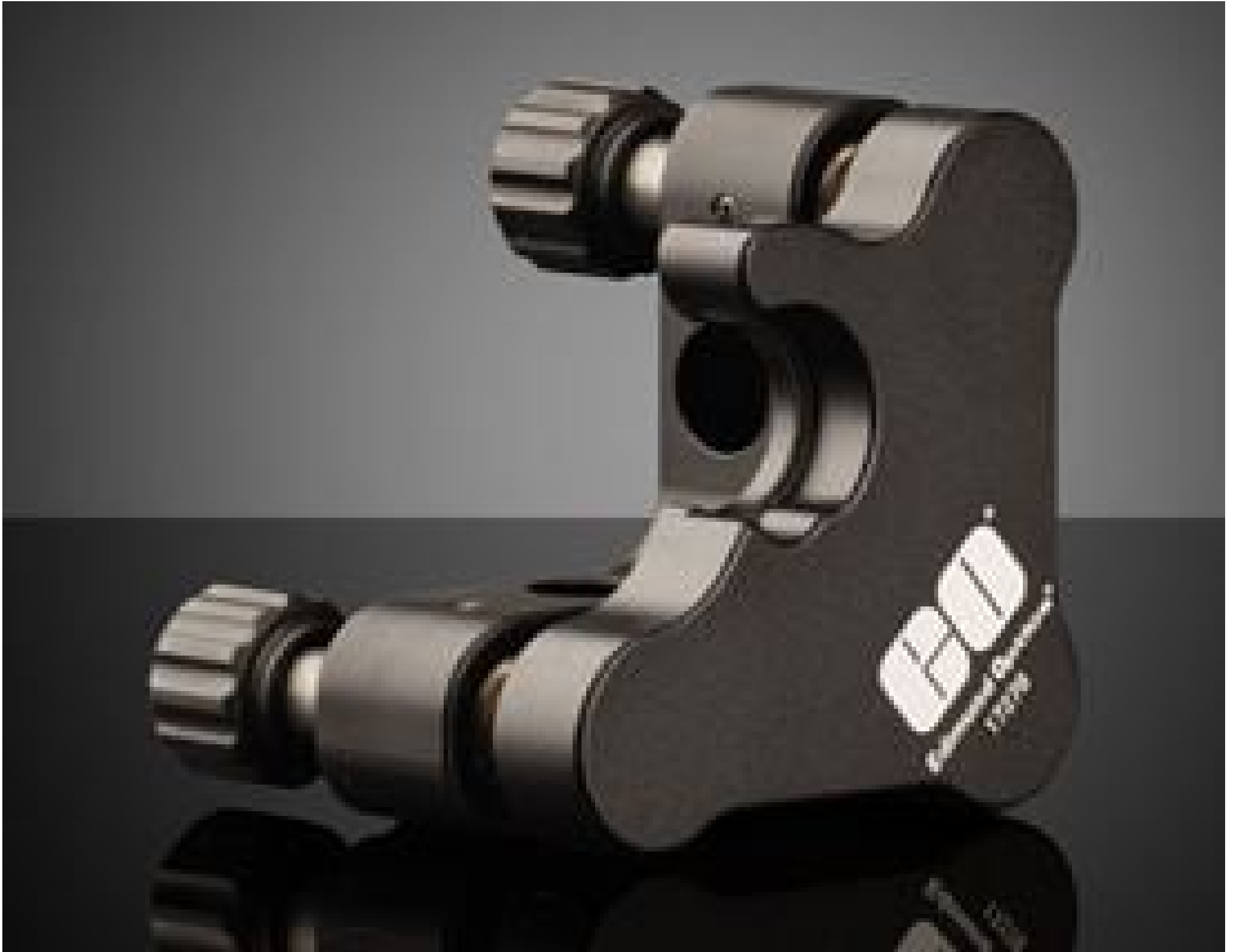
#17-278, 12.5/12.7mm Optic Dia., E-Series Clear Edge Kinematic Mount