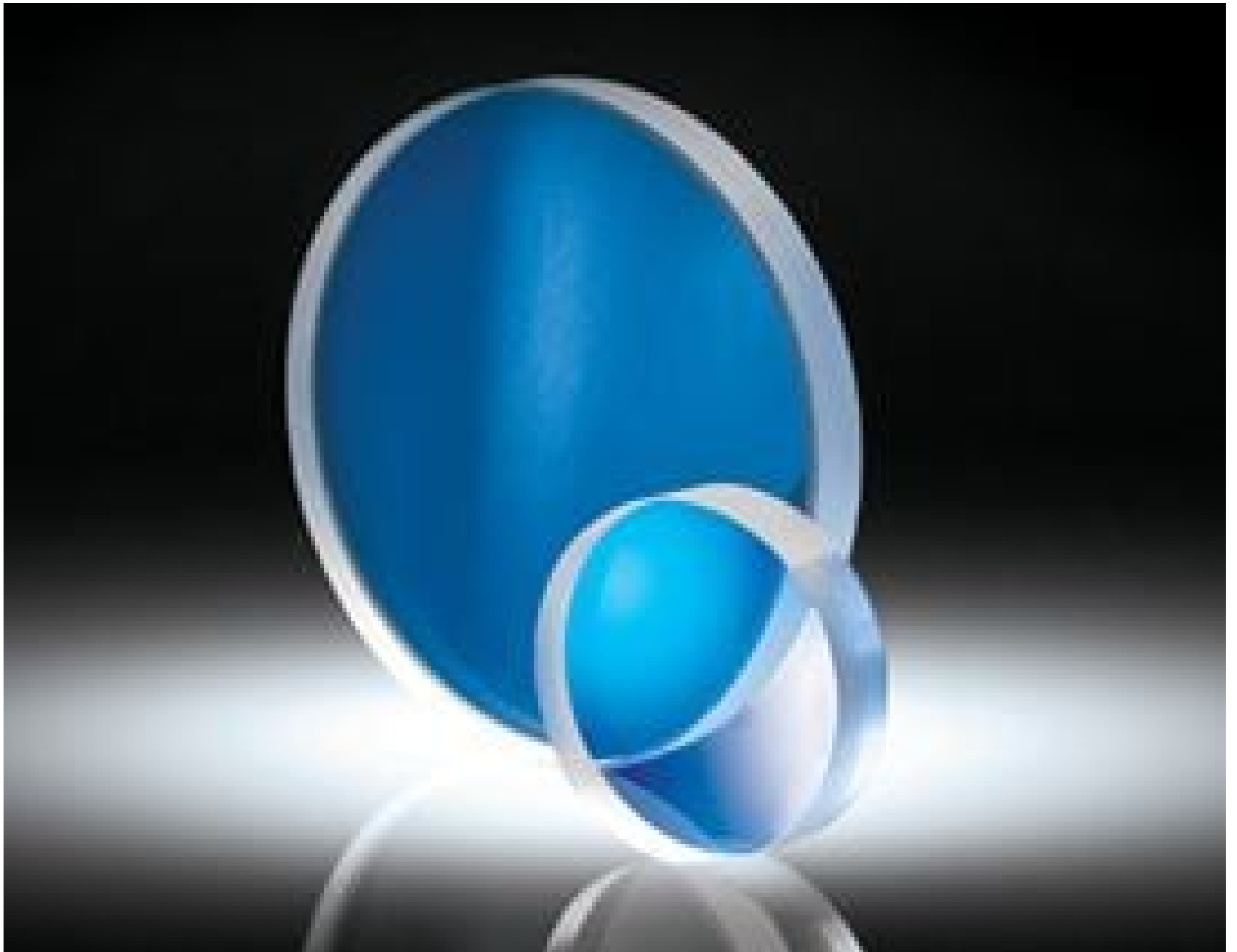
Spherical Aberration Compensation Plates