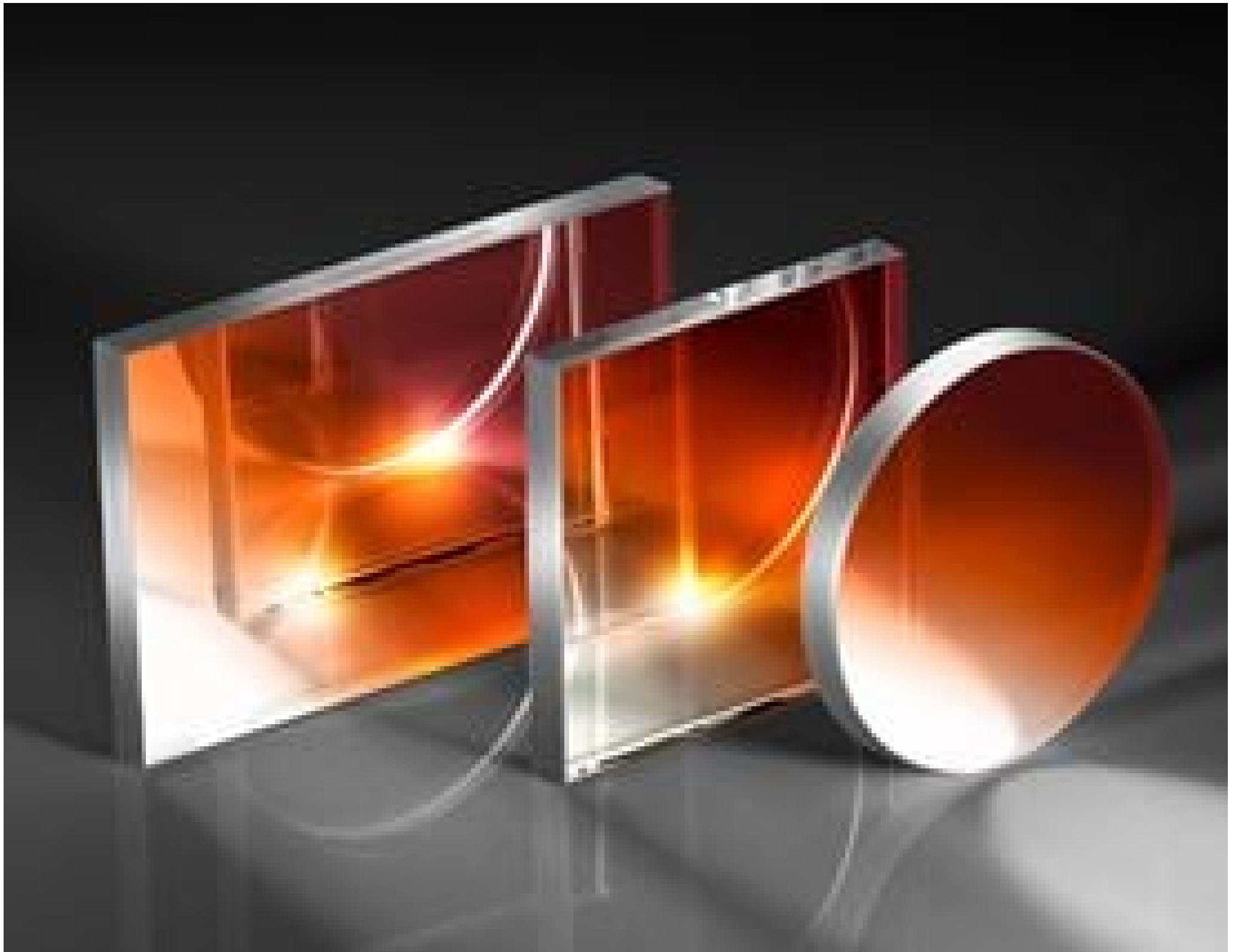
Visible and NIR Plate Beamsplitters