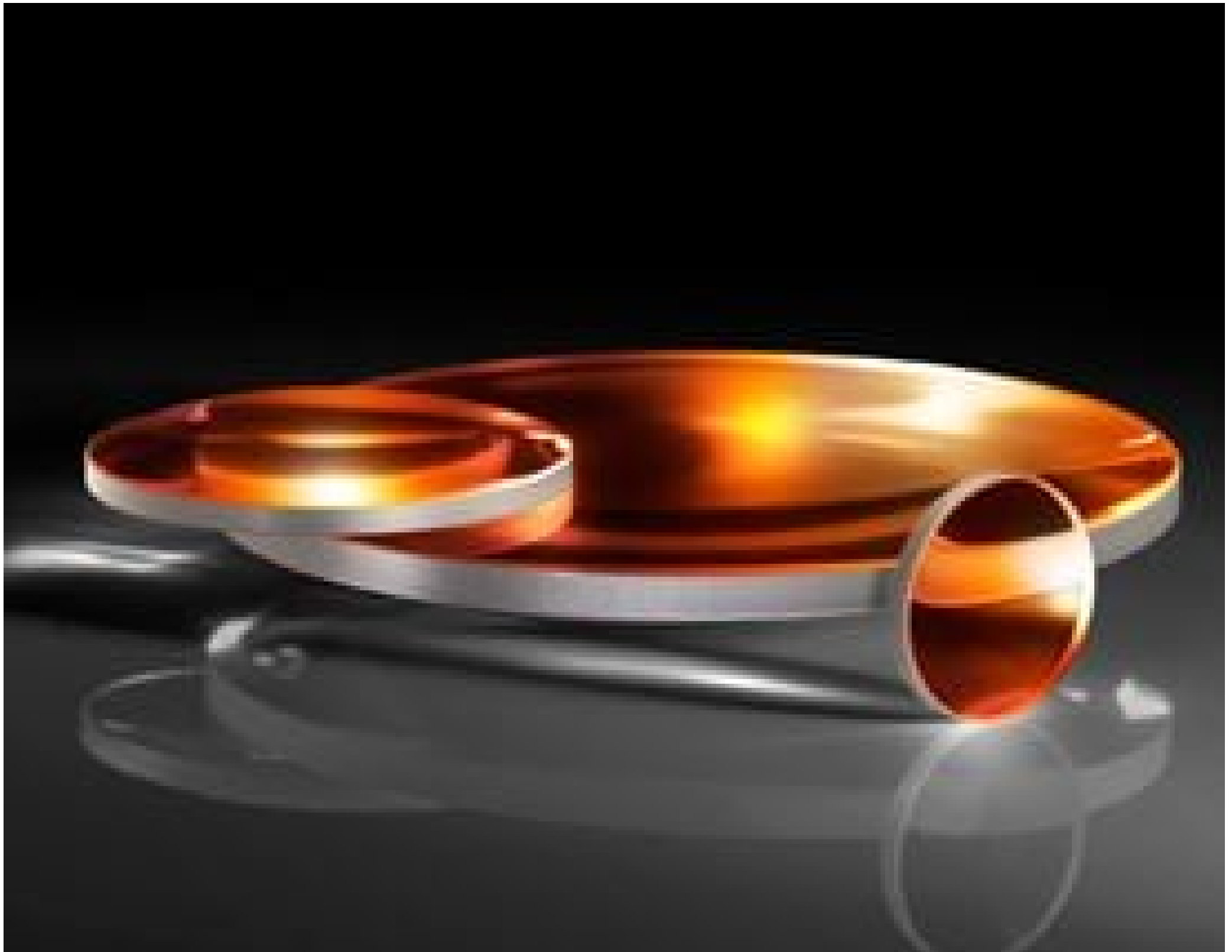
TECHSPEC Calcium Fluoride Plano-Convex (PCX) Lenses