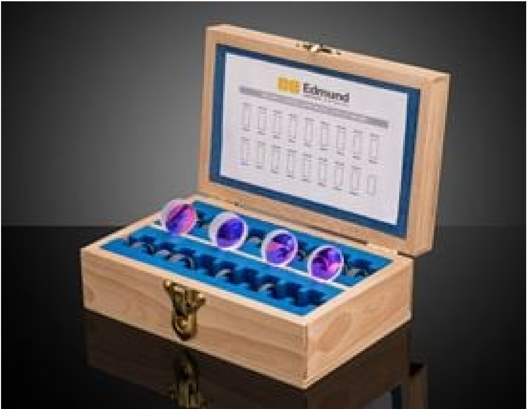
Achromatic Lens Kit