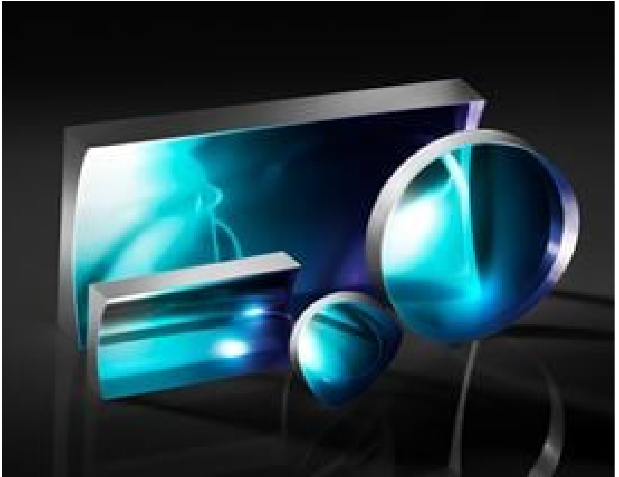
TECHSPEC® Illumination Grade PCV Cylinder Lenses