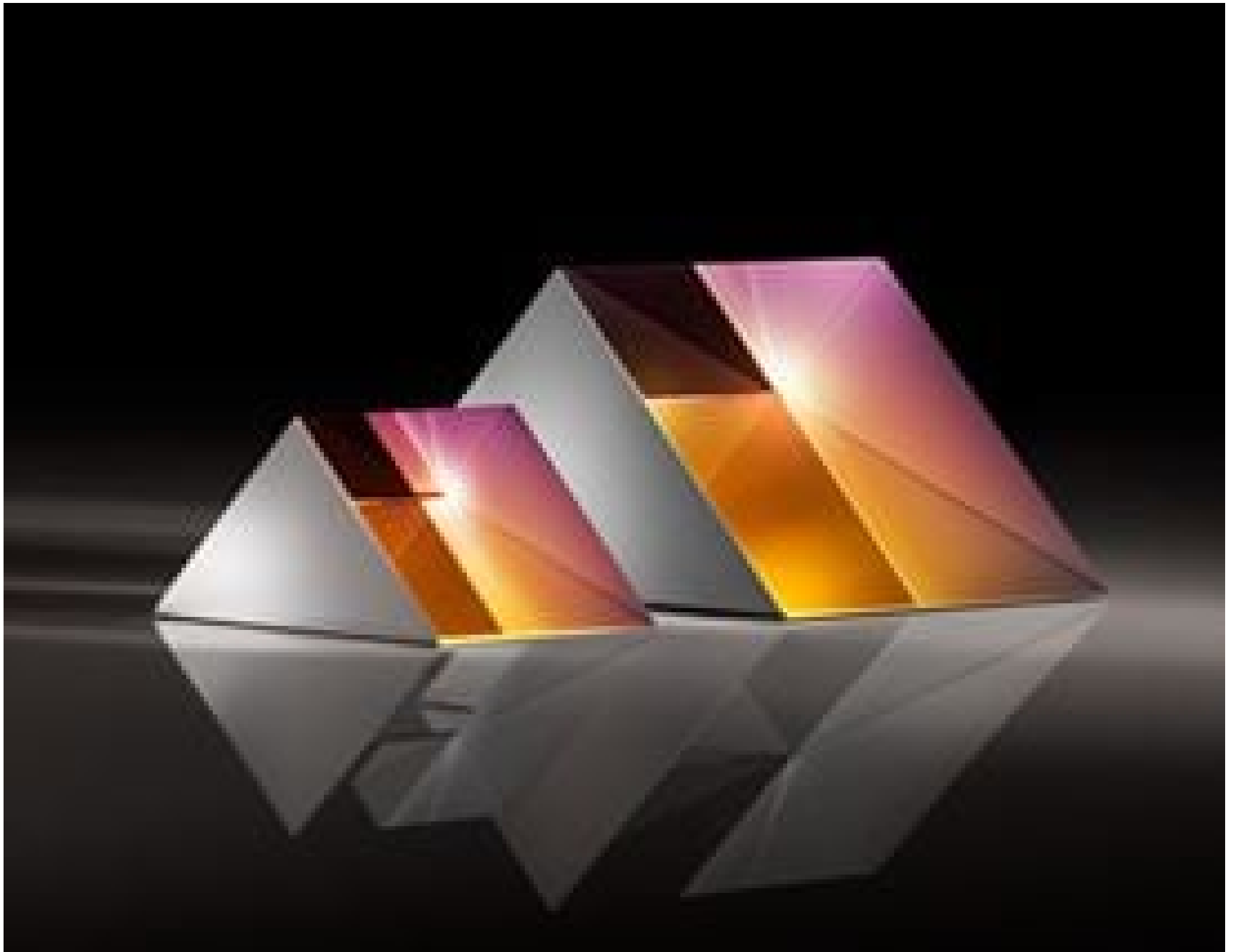
TECHSPEC UV Fused Silica Right Angle Prisms