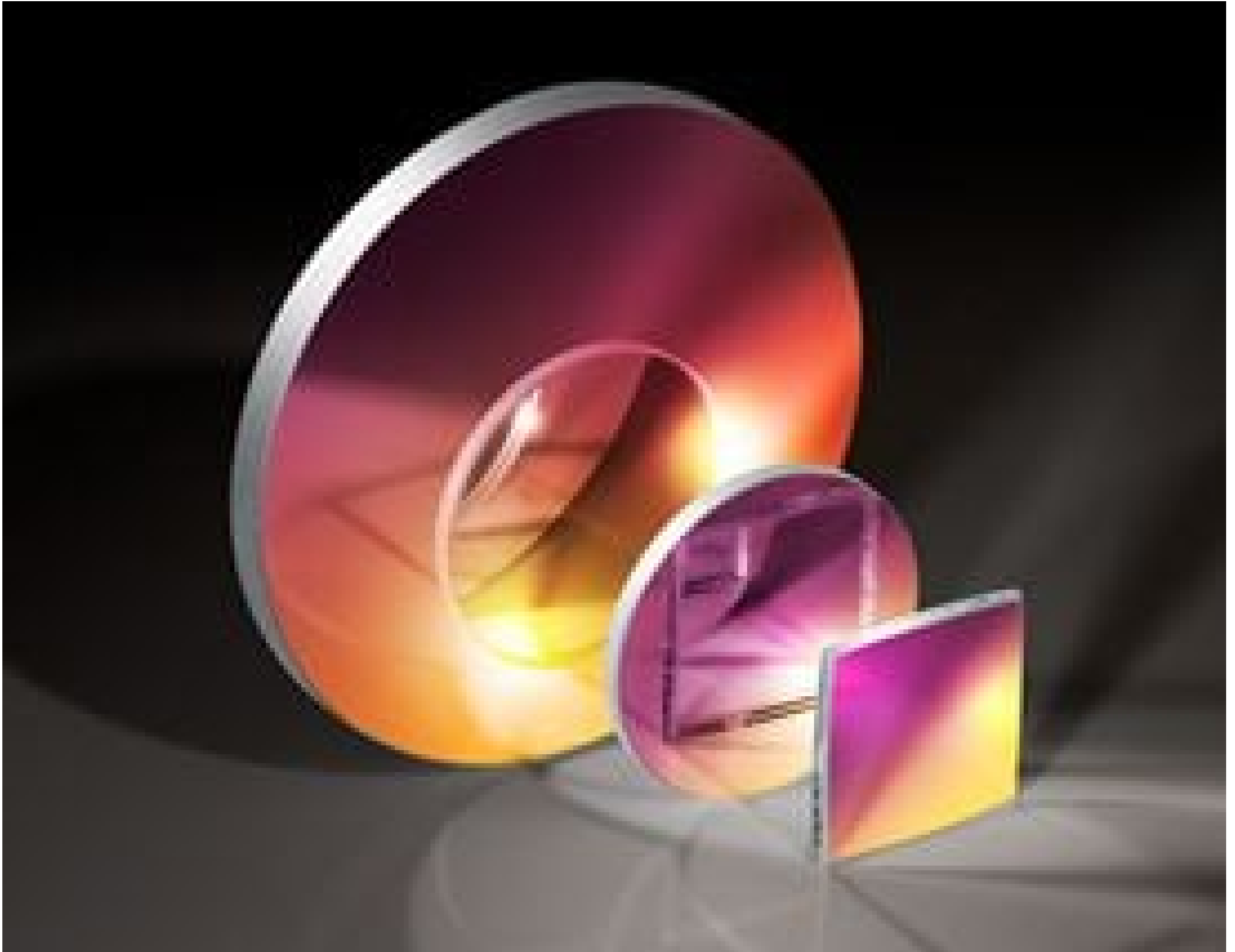
4-6 \lambda First Surface Mirrors