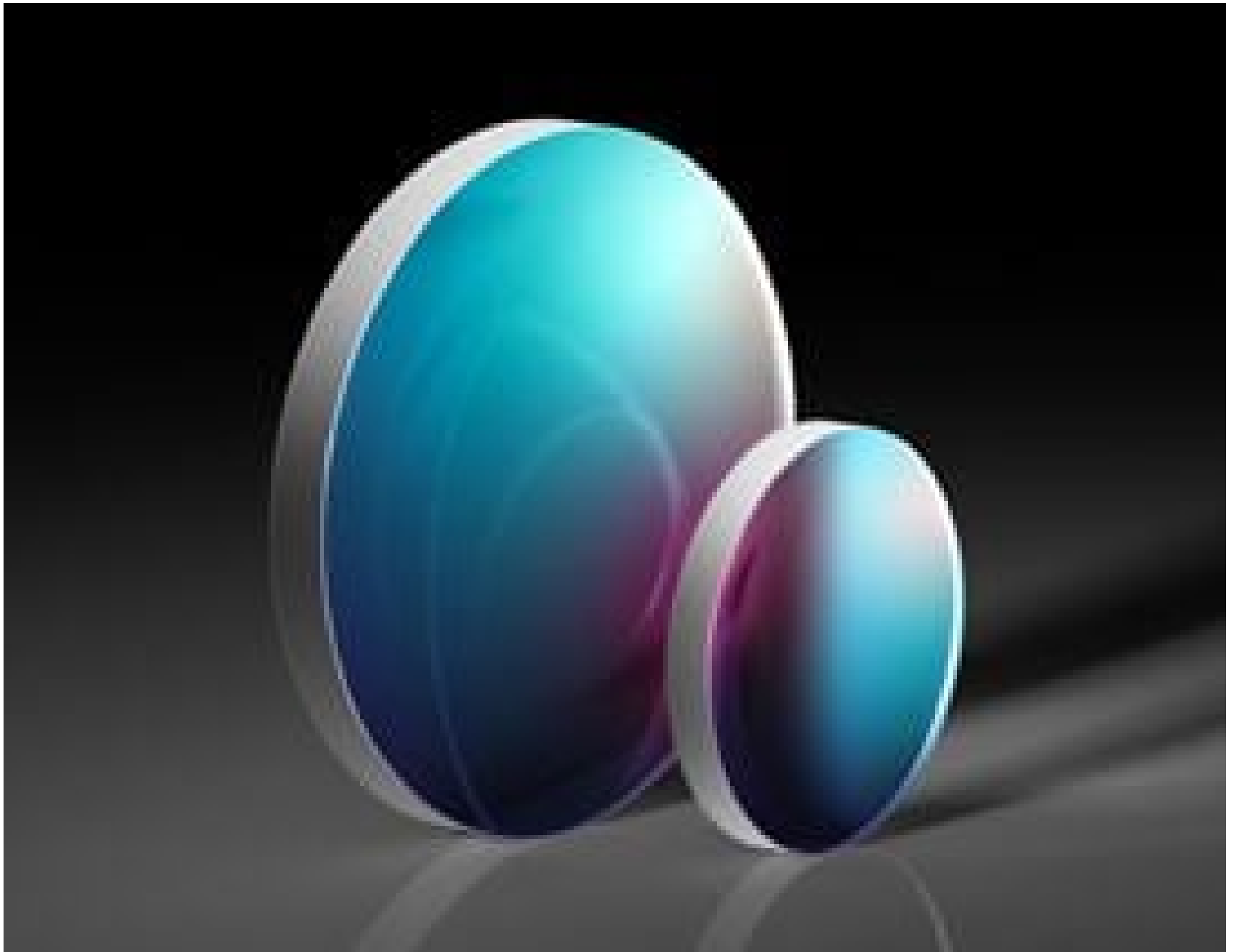
TECHSPEC® Thin Nd:YAG Laser Line Beam Samplers