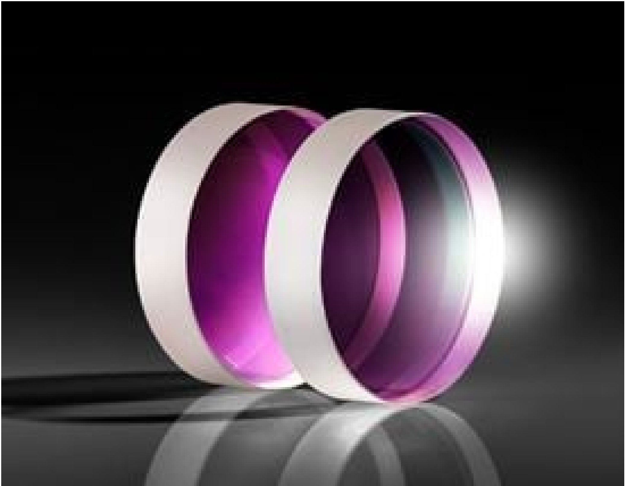
UltraFast Innovations (UFI) Ultra-Broadband Complementary Chirped Mirror Pairs

Mehr Produkte von UltraFast Innovations (UFI)