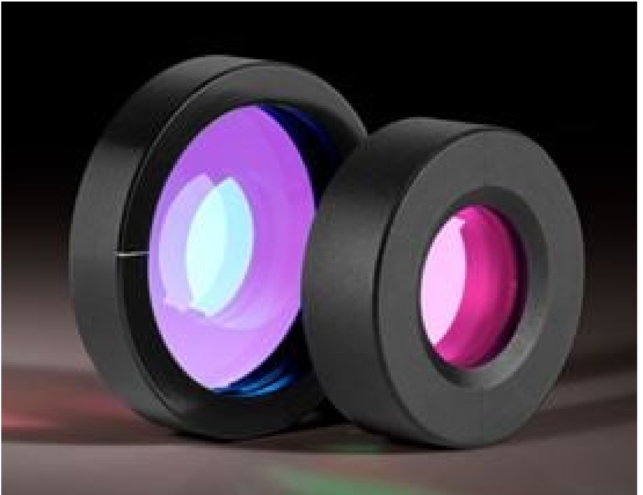
Achromatic Waveplates (Retarders)