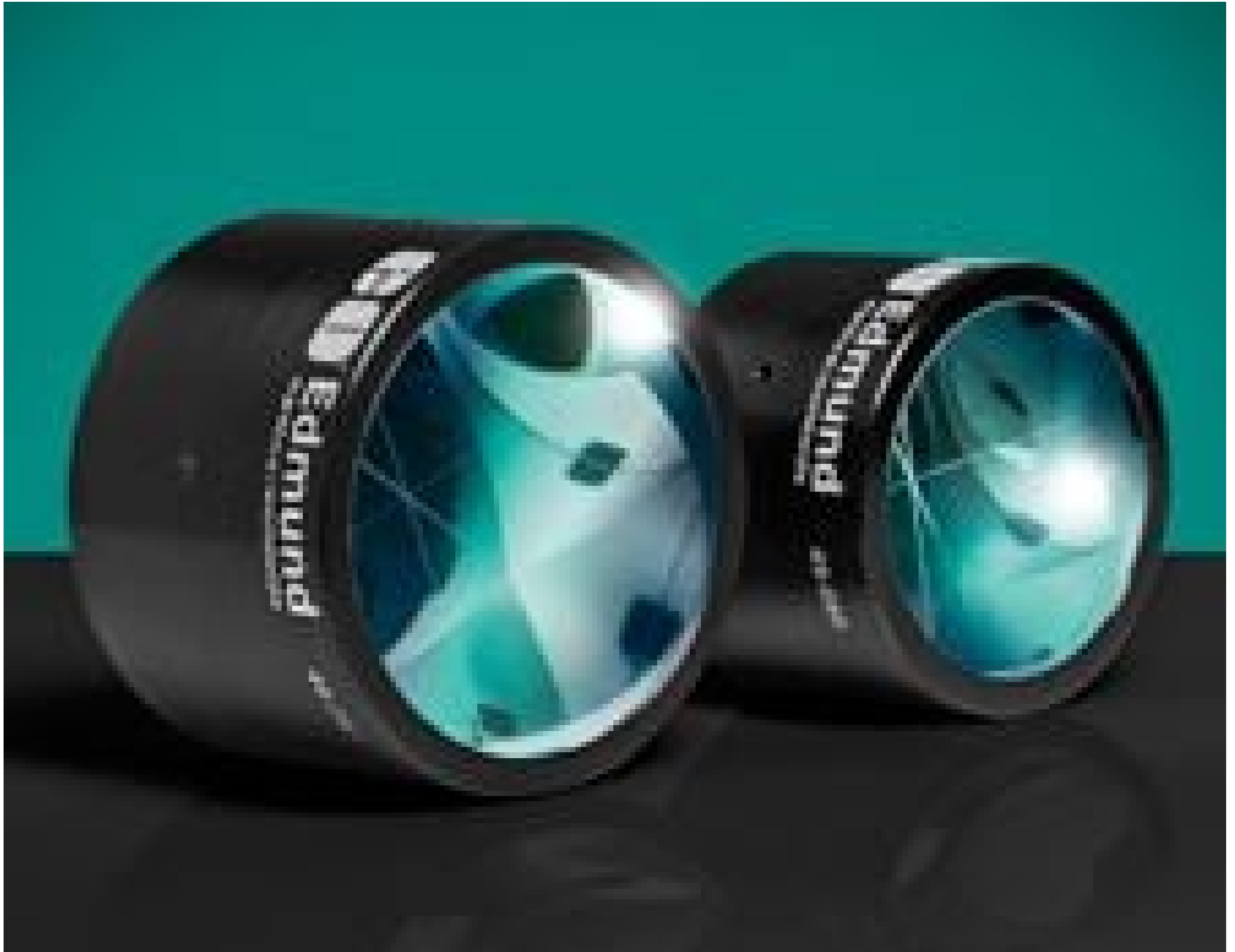
Mounted Fused Silica Corner Cube Retroreflectors