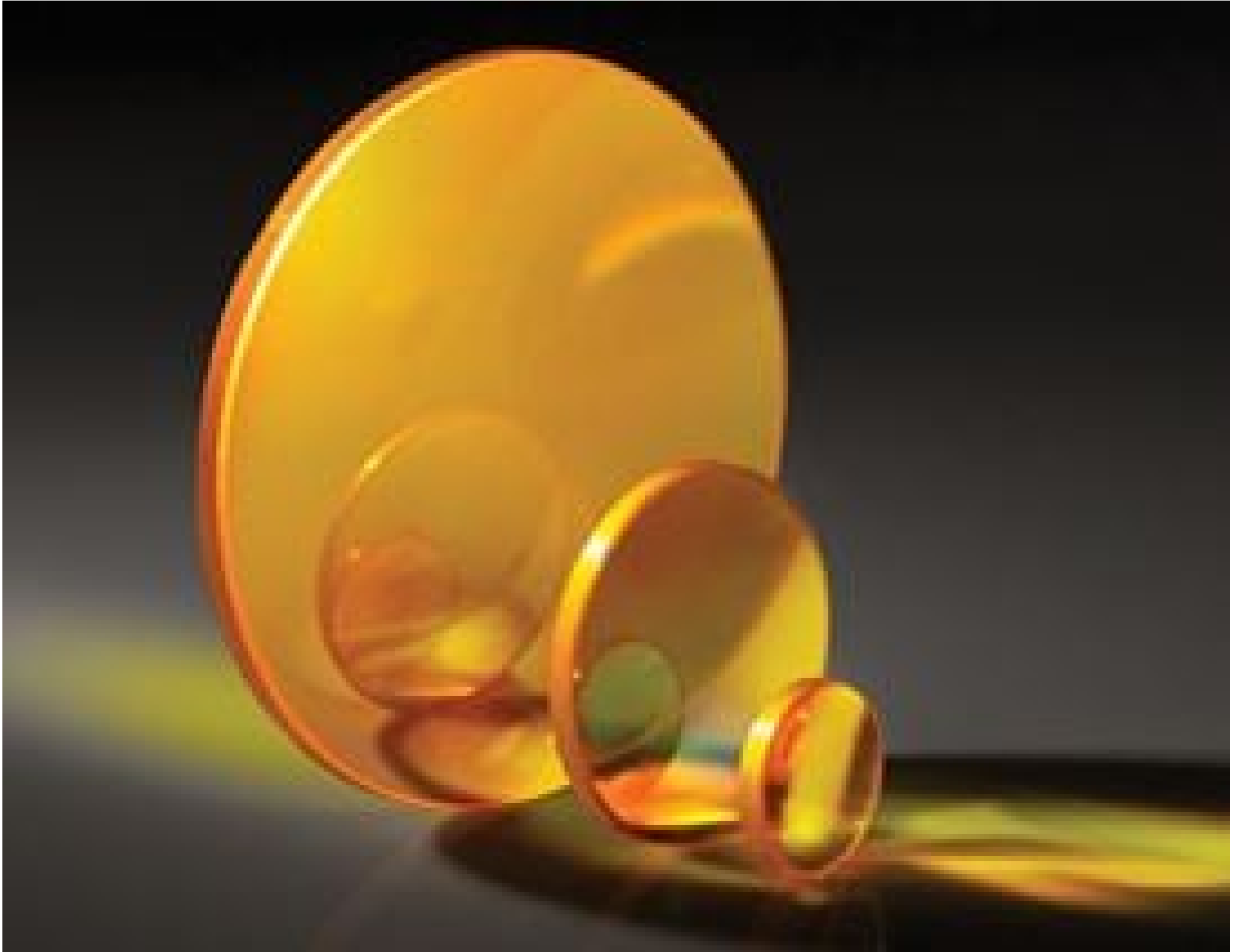
TECHSPEC Zinc Selenide (ZnSe) Plano-Convex (PCX) Lenses